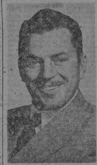
John Carroll, popular actor cantante, que reanuda su carrera en la pantalla después de dos años de permanencia en el cuerpo aéreo norteamericano

Celia Gámez ha concedido un permiso de dos meses a los elementos de su compañía hasta su presentación en el teatro Alodrás, en el próximo septiembre.