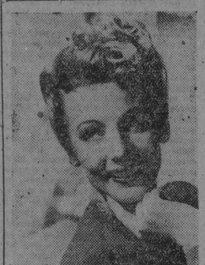
Signe Hasso "estrella" sueca que actualmente actúa en los estudios de Hollywood, bajo el control de la Metro