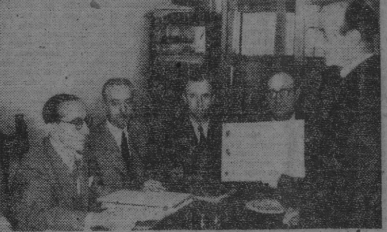
La mesa del Sindicato Provincial del Metal, en Madrid, recibiendo los plegos sellados de las elecciones sindicales recientemente celebradas.