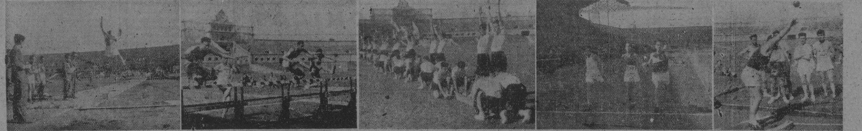
Las diversas jornadas de la VI Semana Deportiva Militar que vienen celebrándose con gran éxito y con una afluencia de participantes digna del mayor elogio para los Cuerpos de la guarnición, culminarán mañana en el magno festival que tendrá por escenario el campo de Las Cortes. La Junta Regional de Educación Física, que con tanto acierto ha organizado los diversos actos de esta VI Semana Deportiva Militar, ha reunido para mañana un brillante conjunto de atracciones deportivas que llevarán un gran número de público al campo del club azulgrana. Nuestras fotografías muestran diversos aspectos de, las pruebas de atletismo celebradas ayer en el Estadio, y en las que puede apreciarse la rivalidad y afán de triunfo que pusieron en la lucha todos los atletas.