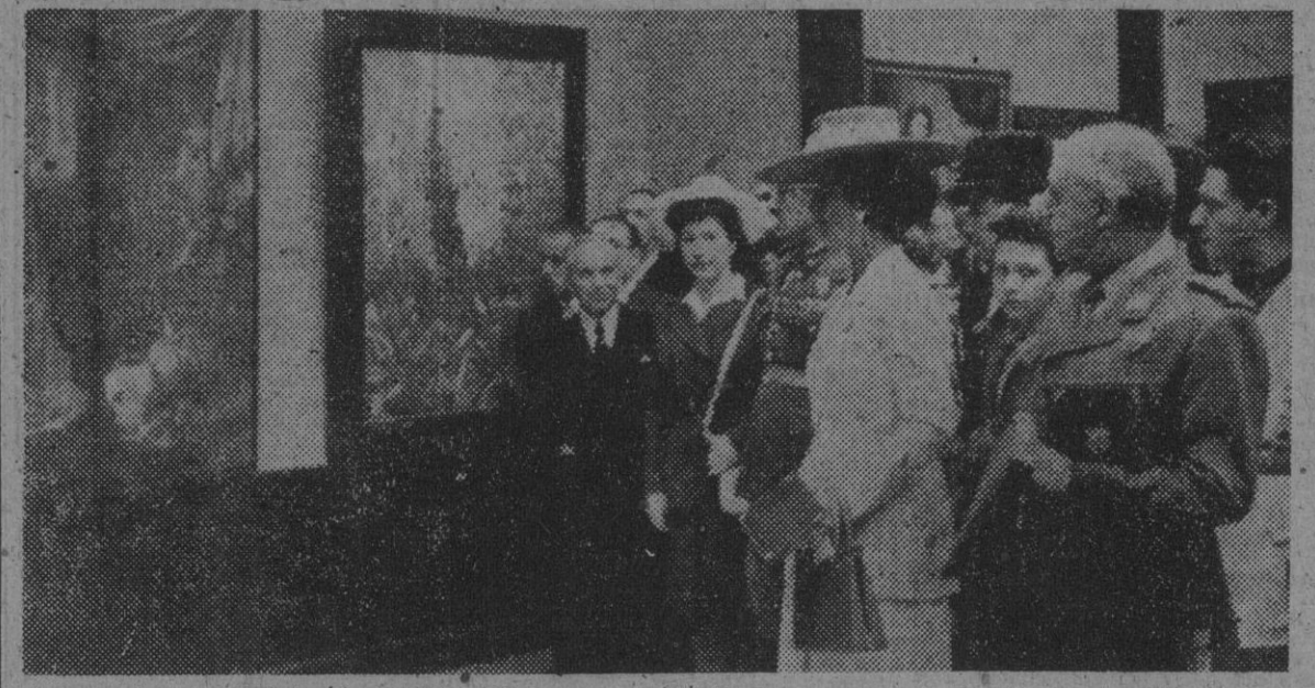
S. E. el Jefe del Estado, Generalísimo Franco, acompañado de su esposa y de otras personalidades, en el acto inaugural de la Exposición Nacional de Bellas Artes, que ha quedado instalada en el Palacio de Exposiciones del Retiro.