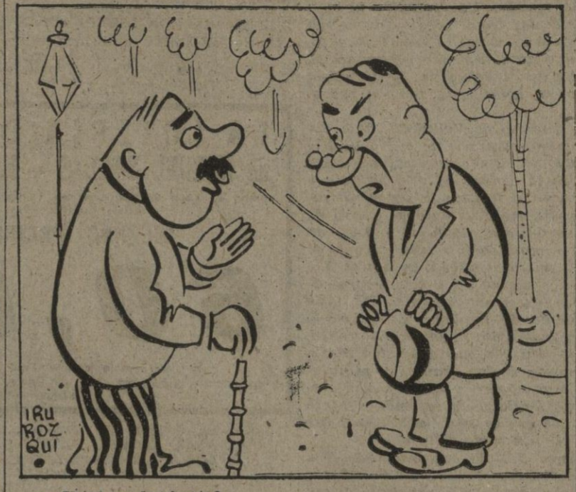
—¿Usted es democrata? —¿Y eso qué es?