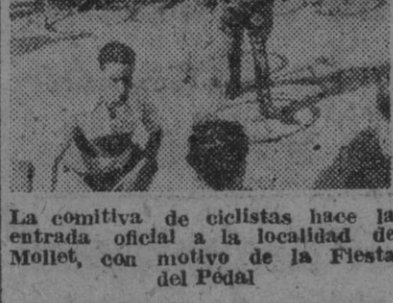
La comitiva de ciclistas hace la entrada oficial a la localidad de Mollet, con motivo de la Fiesta del Pedal