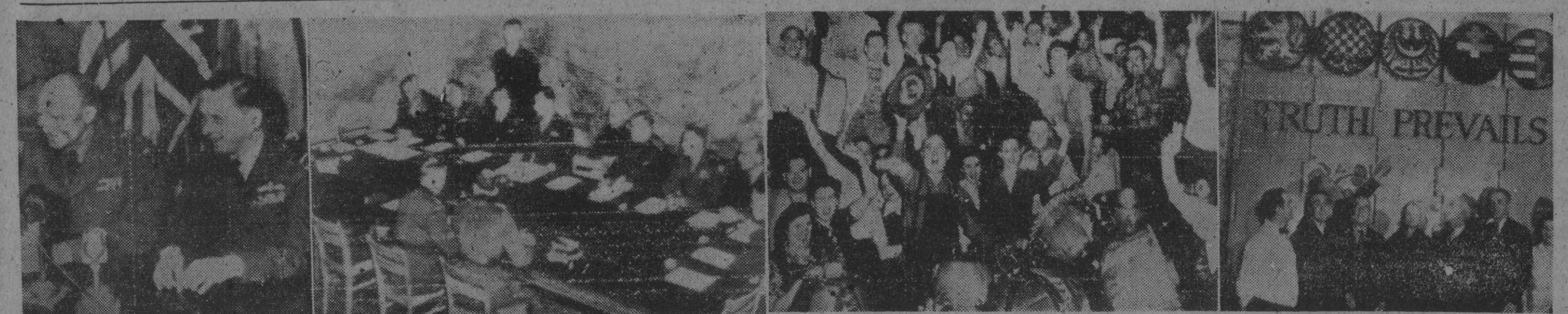
I. El general norteamericano Eisenhower anuncia la capitulación incondicional de Alemania, en Reims. — II. En el local de unas escuelas de Reims se preparan las cláusulas de la rendición de las fuerzas alemanas. — III. Los obreros de la fábrica "Ford", de motores de aviación, suspenden su trabajo unos momentos para festejar la proclamación del día de la victoria. — IV. Checoslovacos residentes en Nueva York, reunidos en su local social, celebran el anuncio de la victoria.