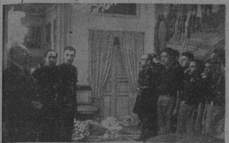
S. E. el jefe del Estado, Generalísimo Franco, dirigiendo la palabra a los camaradas cadetes del campamento de Rurales de la Casa de Campo, que le ofrendaron frutos en su palacio de El Pardo con motivo de la festividad de San Isidro.