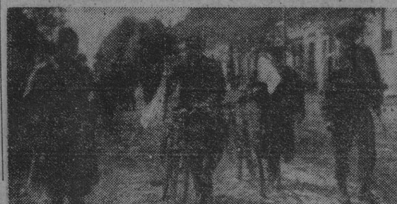
El burgomaster de Nieder Lptie, acompaña a un oficial del ejército norteamericano (derecha) para pedir la rendición de Zerest, al sudoeste de Magdeburgo. — (Foto Sena, recibida por radio)