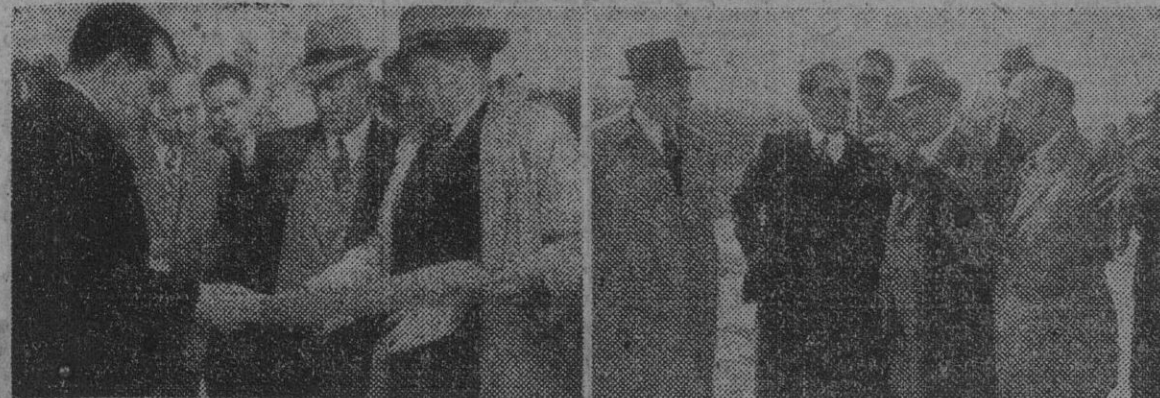
El Excmo. señor ministro de Obras Públicas, don Alfonso Peña, examinando los planos del puente sobre el Llobregat, en la carretera del Prat, y estudiando sobre el terreno las obras que se realizan