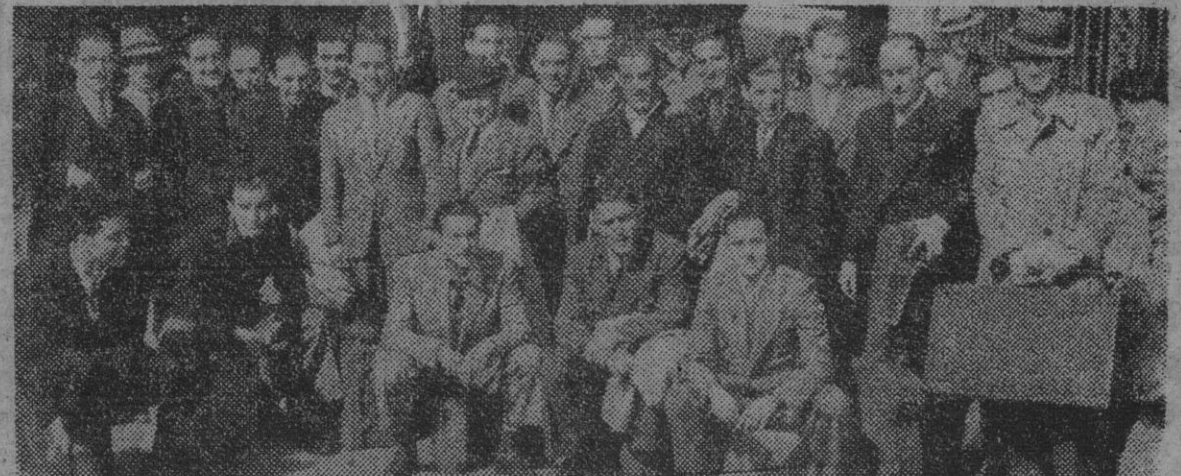
Los componentes del Grupo de Empresa de "Educación y Descanso" de la Prensa del Movimiento, de Madrid, a su llegada a la estación de Francia, donde han sido recibidos por representantes del Grupo de Empresa LA PRENSA y "Solidaridad Nacional".