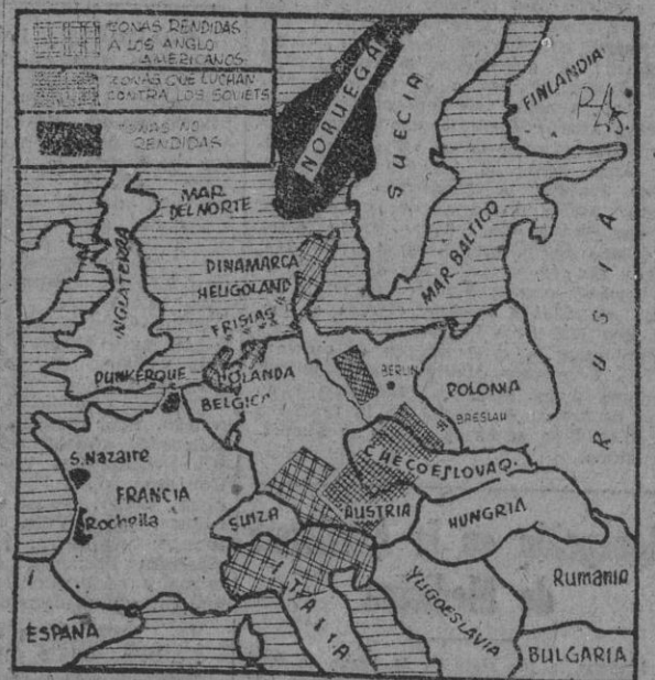
En cuyo país se ha restablecido la legalidad existente antes de la guerra. También en Holanda se restablece rápidamente la situación. F. BARATECH

A diferencia de la Liga de las Naciones, que dependió inicialmente de árbitros y sanciones, Boncour propone que todas las potencias, prometan proveer la ayuda militar para aplicar las decisiones del nuevo Consejo de Seguridad, asignando unidades militares permanentemente al mando del Estado Mayor Internacional del Consejo. La designación de Boncour ha sido casi impuesta por el ministro británico de Relaciones Exteriores, Anthony Eden. — Efe.