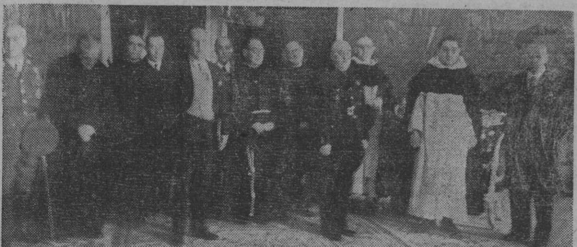
S. E. el Jefe del Estado, Generalísimo Franco, con la Comisión de Filipinas que le ha visitado en su residencia del Pardo para agradecerle las medidas adoptadas en defensa de los intereses españoles en aquellas islas.

El Caudillo recibe a una Comisión de Filipinas