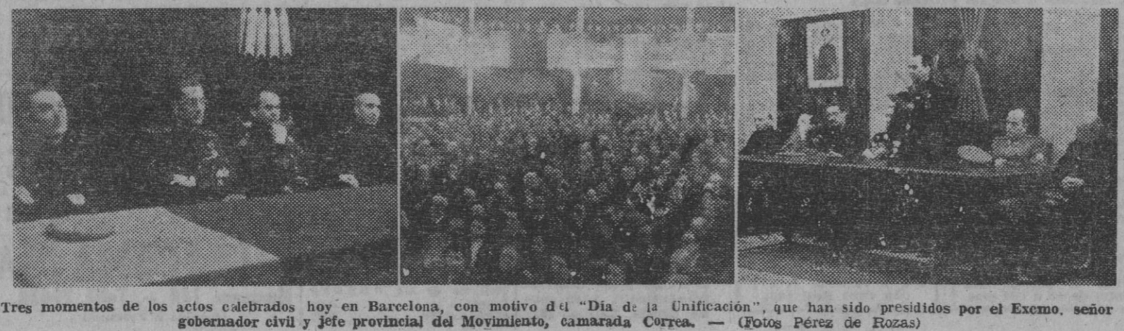
Tres momentos de los actos celebrados hoy en Barcelona, con motivo del "Día de la Unificación", que han sido presididos por el Excmo. señor gobernador civil y jefe provincial del Movimiento, camarada Correa.