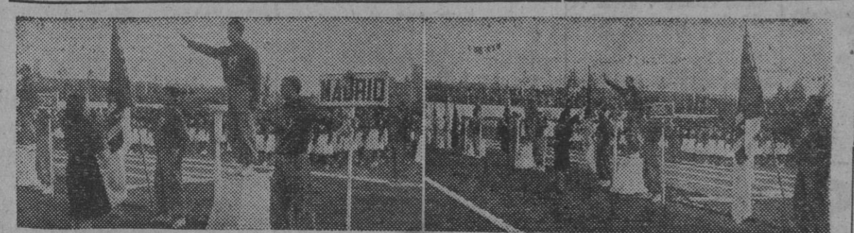
El acto final de los II Juegos Universitarios Nacionales, celebrados en Madrid, ha sido el reparto de premios a los vencedores. La foto primera nos presenta la entrega del premio al grupo madrileño, y la segunda el equipo barcelonés.