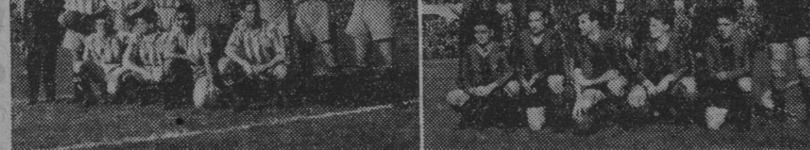
Los equipos del Español y Barcelona que se enfrentaron en el Estadi de Montjuich.

También el Coruña ganó posiciones al batir ampliamente al Atlético Aviación, quedándole a este equipo las aspiraciones de la Copa, porque en la Liga sólo nos ha resultado discreto. El Valencia es el tercero en discordia, aspirante a mejor puesto en la clasificación general. Volvió a repetir su victoria de Copa sobre el Sevilla, adjudicándose los dos puntos que le dan esperanzas fundadas.