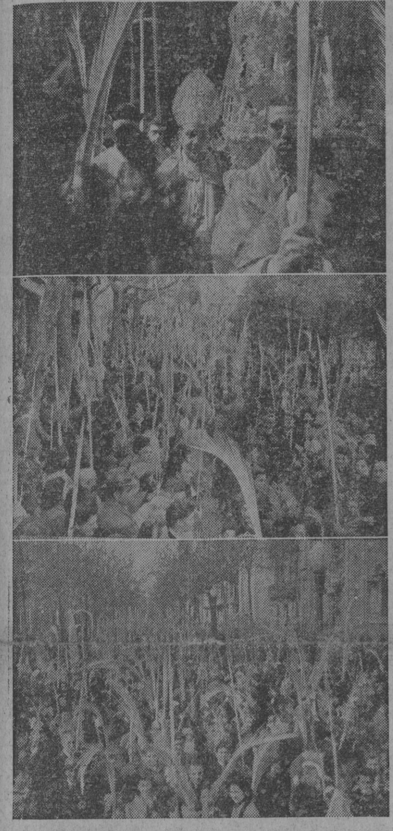
I. El Ilmo. señor obispo de la diócesis, doctor Modrego, bendice las palmas en los claustros de la catedral. II y III. Los fieles esperando la bendición de sus palmas en la plaza de Lesseps y ante la iglesia de Pompeya.