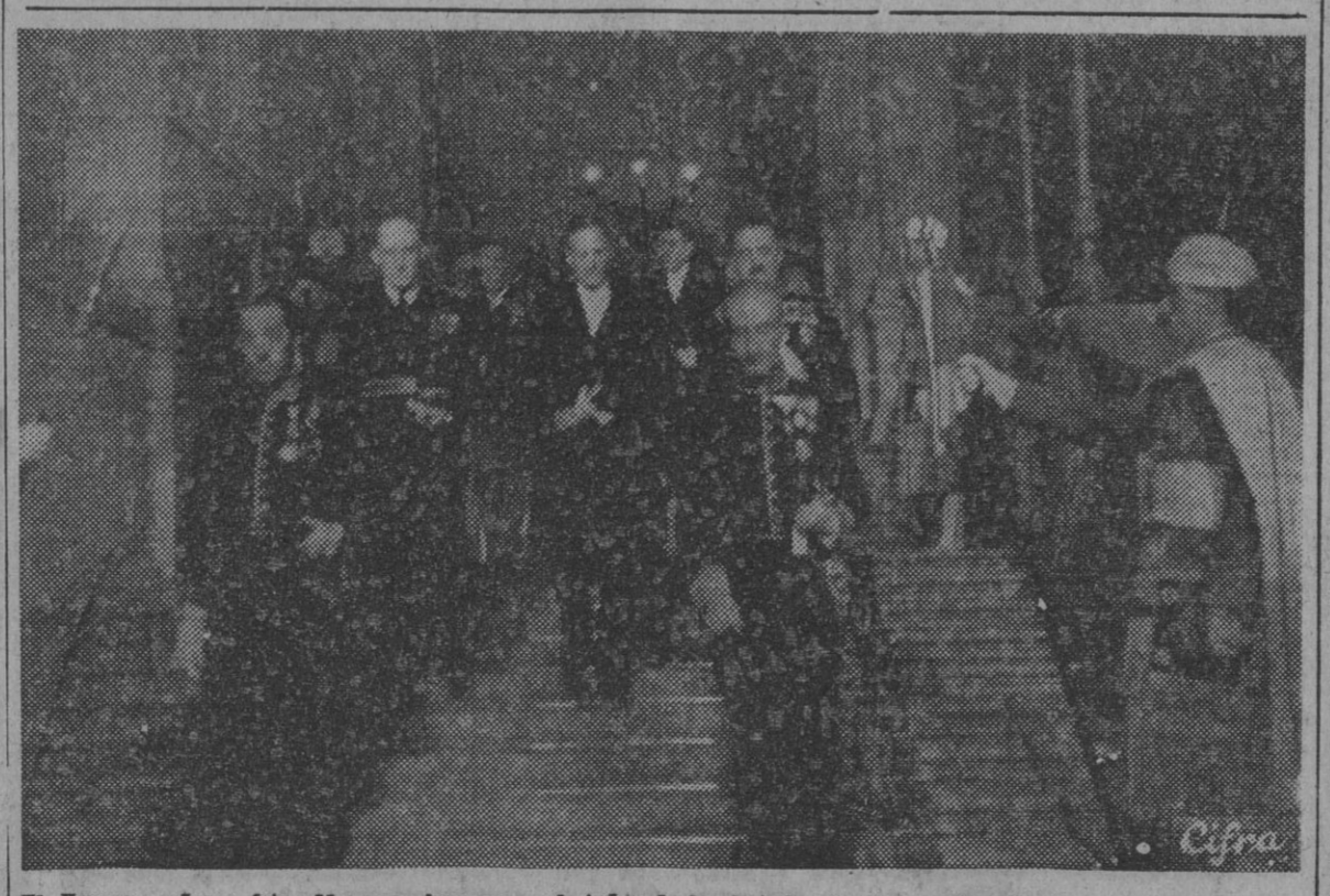
El Excmo. señor mister Norman Armour, embajador de los Estados Unidos en España, a su salida del Palacio de Oriente acompañado del primer introducción de embajadores, barón de Las Torres, después de presentar sus cartas credenciales a S. E., el Jefe del Estado, Generalísimo Franco.