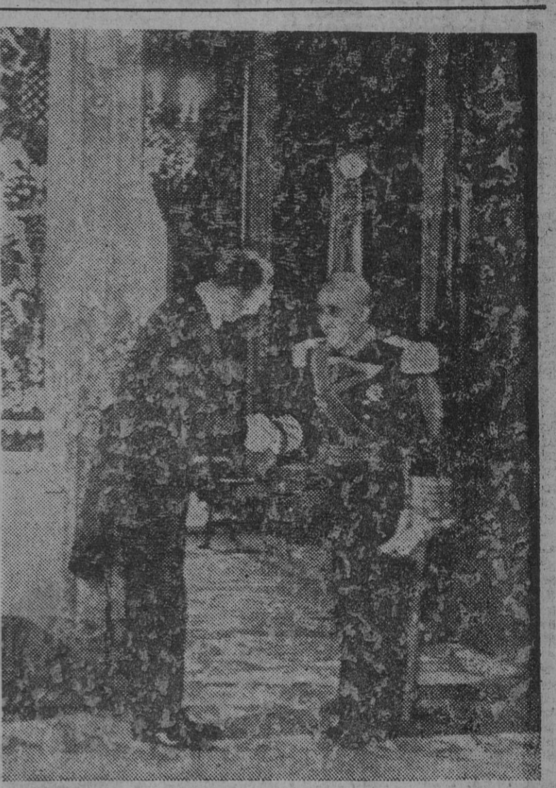
Su Excelencia el Jefe del Estado, Generalísimo Franco, despide al embajador de los Estados Unidos después de la cordial entrevista celebrada en el Palacio de Oriente, en ocasión de presentar mister Norman Armour, sus cartas credenciales.