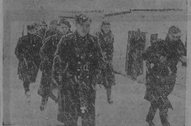
Una patrulla de la "Hlinka-Garde", integrada por soldados de Eslovaquia y que lucha al lado de las tropas alemanas, marchando hacia una posición avanzada bajo un temporal de nieve.