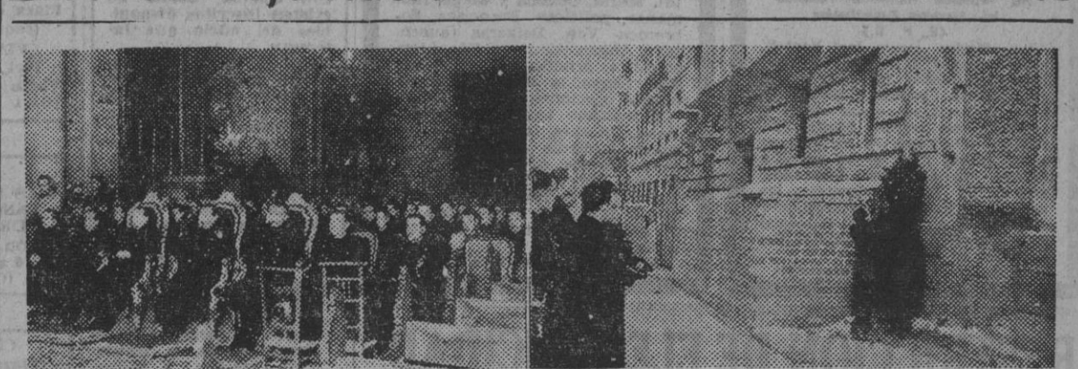
Dos instantáneas de los actos celebrados en Madrid con motivo de celebrarse en la capital de España el IV Consejo Nacional del Frente de Juventudes. 1. Los jerarcas en la iglesia de Santa Bárbara, durante la celebración de una misa por los Caídos. — 2. Momento de ser depositada una corona de laurel en el lugar donde fué asesinado el camarada Matías Montero, primer Caído del Sindicato Español Universitario