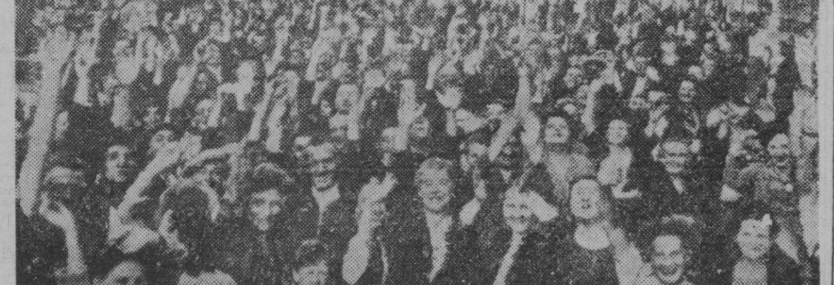
La población de París recibe con una manifestación a las tropas norteamericanas y francesas que entran en la capital de Francia. — (Foto recibida por radio)

Ha constituido una imponente manifestación de duelo Monseñor Cicognani, nuncio de S. S., ha oficiado en la misa de réquiem LOS RESTOS DEL ILUSTRE FINADO HAN SIDO INHUMADOS EN LA CATEDRAL DE BURGOS