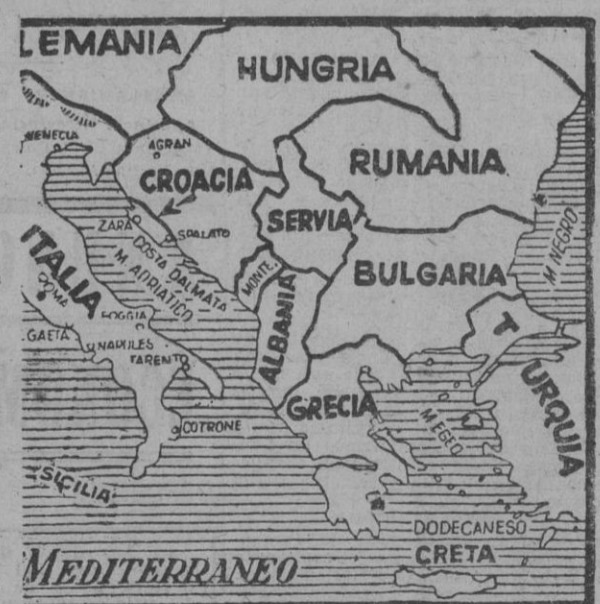
Los aliados replican que las tropas búlgaras se hicieron cargo de alpinas y montañas en el sur de Yugoslavia, llevando la frontera hasta Albania, y en el norte y nordeste de Grecia, hasta el Egeo. Bulgaria no tiene fronteras comunes con Alemania, ni con Rusia, y su posición ante Moscú es de neutralidad. Los peores enemigos de Bulgaria no son hoy Rusia e Inglaterra, sino Grecia y Yugoslavia, pero éstos actúan al dictado de las potencias británica y soviética, y lo que éstas decidan prevalecerá en definitiva. Finalmente, parece ser que la antigua Checoslovaquia entra en una nueva etapa de agitación, coincidente con la proximidad de los ejércitos soviéticos a sus fronteras. Masarik y Benes tratan de sacar punta a los sucesos de Eslovaquia, denunciados por el presidente Tisso, y al efecto han pronunciado por radio arengas y alocuciones excitando a checos y eslovacos a sublevarse contra los alemanes. F. BARATECH

El jefe de la Oficina de Reclutamiento del Ministerio de la Guerra ha manifestado que desde el comienzo del conflicto en China la población de la isla de Formosa ha suministrado un gran número de voluntarios, los cuales se han cubierto de gloria. La aplicación de esta medida en Formosa, significa al mismo tiempo que el Gobierno general eleva al rango de Estado hermano. — Efe.