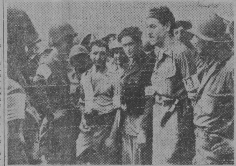
Fuerzas americanas en avance, hacia el sur de Francia, entran en contacto con grupos franceses que también luchaban contra los alemanes (Foto recibida por Radio)