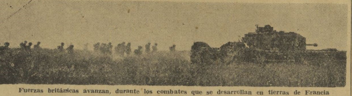
Fuerzas británicas avanzan, durante los combates que se desarrollan en tierras de Francia