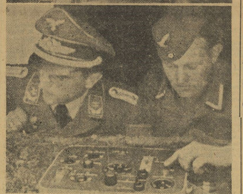
I. El avión sin piloto en el momento de iniciar su vuelo. — II. Colocación del "V-1" en la instalación propulsora. — III. Control del aparato ya en pleno vuelo.