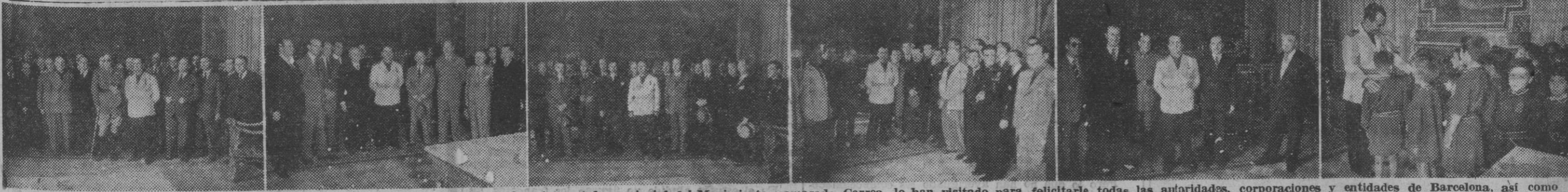
Con motivo de celebrar hoy la festividad de su Santo, el Excmo. Sr. gobernador civil y jefe provincial del Movimiento, camarada Correa, le han visitado para felicitarle todas las autoridades, corporaciones y entidades de Barcelona, así como gran número de amigos personales. La presente información gráfica recoge algunos momentos del continuo desfile habido esta mañana en el Gobierno Civil, para hacer llegar al camarada Correa el testimonio del afecto que nuestra ciudad le profesa. I. El capitán general de la Región, con el gobernador civil. Acompañan a los dos personalidades los representantes de la Prensa barcelonesa. — II y III. La Diputación Provincial y el Ayuntamiento en pleno en su felicitación al camarada Correa. — IV. Las jerarquías de la Jefatura Provincial del Movimiento, felicitando a su jefe. — V. El subdelegado de Abastecimientos, con el personal a sus órdenes, cumplimentando a S. E. — VI. Niños de las escuelas de Barcelona, felicitando al camarada Correa. — (Fotos Pérez de Rozas)