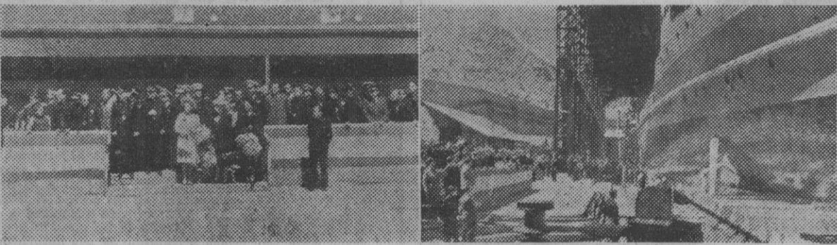
Con asistencia de los ministros secretario general del Movimiento y de Educación Nacional, se ha procedido, en Cartagena, a la botadura del nuevo dragaminas "Nervión". He aquí dos detalles del acto

Ha sido cumplimentado esta mañana por todas las autoridades y jerarquías de la ciudad