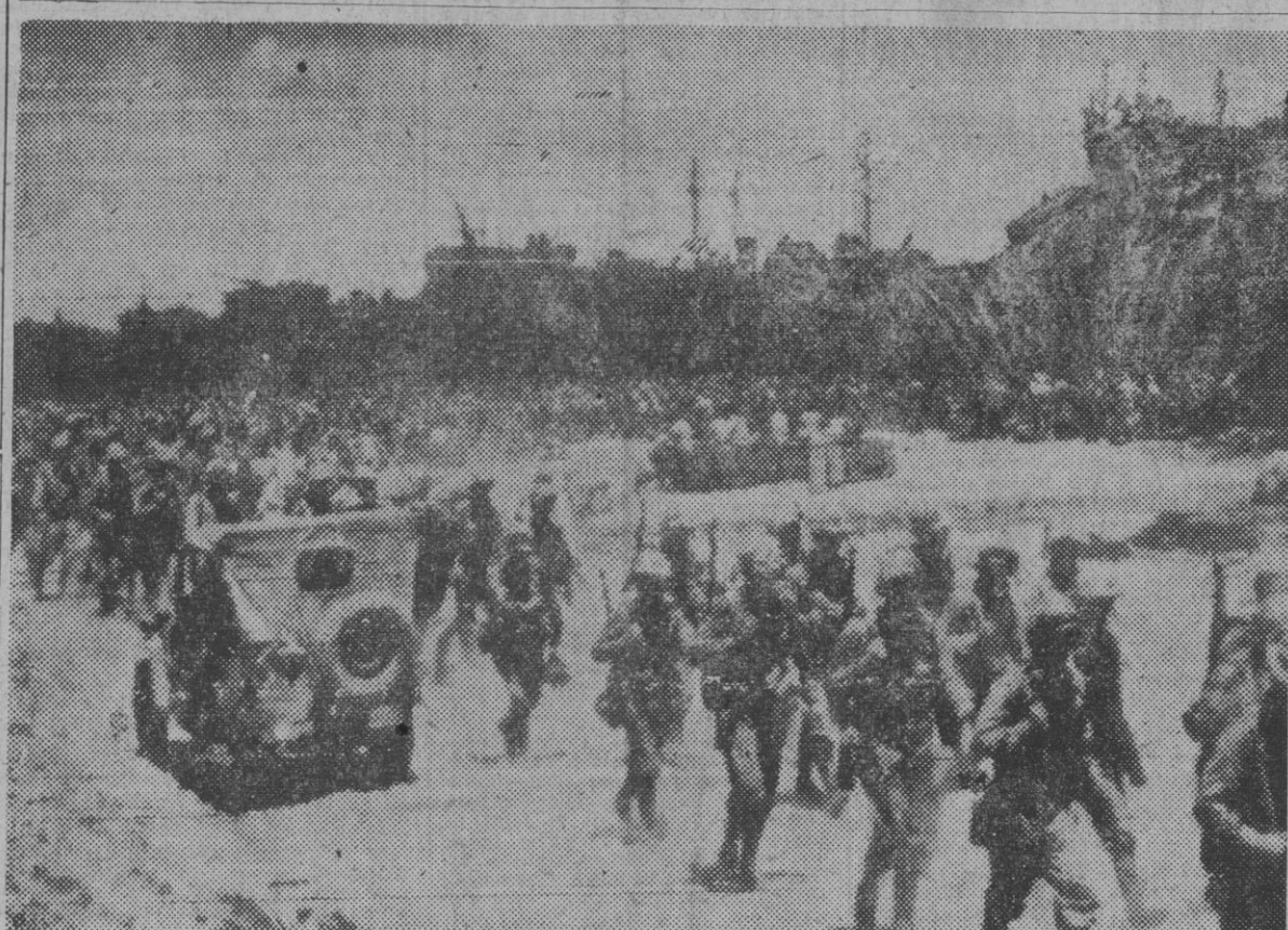
Unidades del ejército norteamericano desembarcando en la costa del Cabo de Gloucester. Estas tropas llevarán ayer a cabo la ocupación del archipiélago de San Matías, al norte de Nueva Bretaña