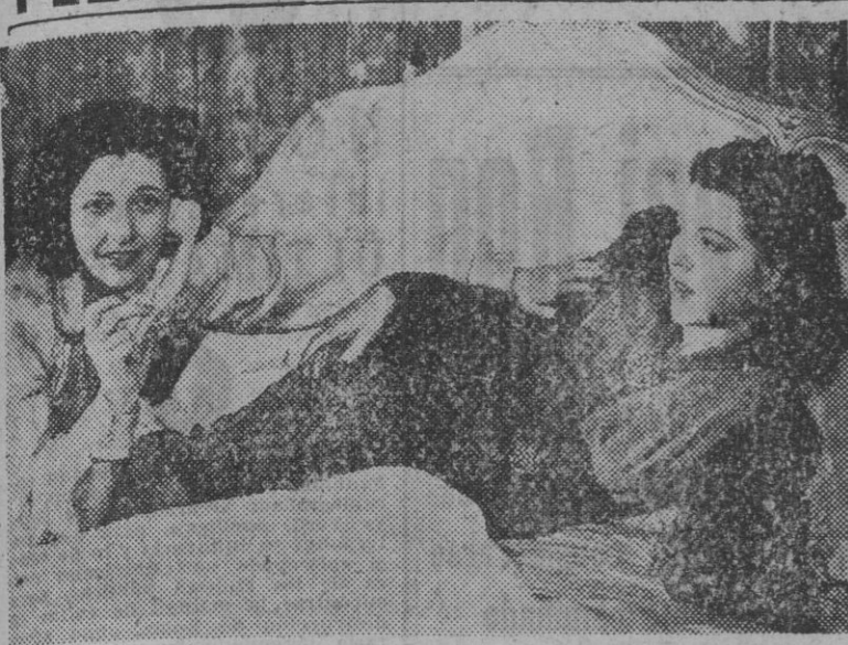
Diana Barrymore y Kay Francis en una escena de la producción Universal, 'Entre nosotras', que hoy se estrena en el Fantasio