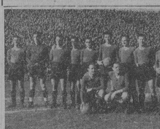
Los equipos del U. F. Baiona y R. C. D. Español, que ayer jugaron en Las Cortes.

ZUBELDIA. El primer tiempo fué de juego favorable al Español, que ligó mejor sus jugadas imprimiendo en ellas mucho entusiasmo y realizándolas a base de pases rápidos, ante un Barcelona evidentemente desconcentrado por la falta de alguno de sus jugadores titulares. Marcó el Español en primer tiempo a los diez minutos de juego, por obra de Jorge, el cual disparó a distancia un balón bien servido por Diego, en paso rasado adelantado. La pelota se colocó en el marco como la exhalación, sin que Quique pudiera hacer nada para detenerla. A los 35 minutos de juego, a consecuencia de una jugada violenta de Pérez a