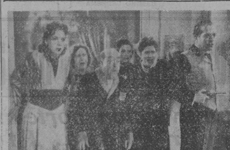
Una escena de «Intriga», film español dirigido por Tony Roman, y que hoy, lunes, será estrenado en los cines Aristos y Plaza