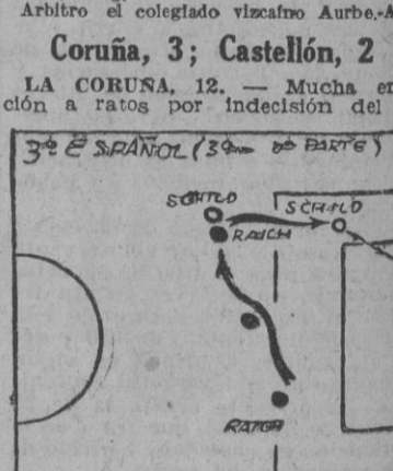
12 ESPAÑOL (3 m 10 PARTE)

Sevilla, 4; A. Aviación, 2. SEVILLA, 13. — El campo del Nervión registró una buena entrada. El partido despertó una enorme emoción. Entre los aficionados sevillanos se veían en las gradas otros llegados de Huelva, Córdoba, Cádiz, Jerez y de los pueblos de la provincia de Sevilla.