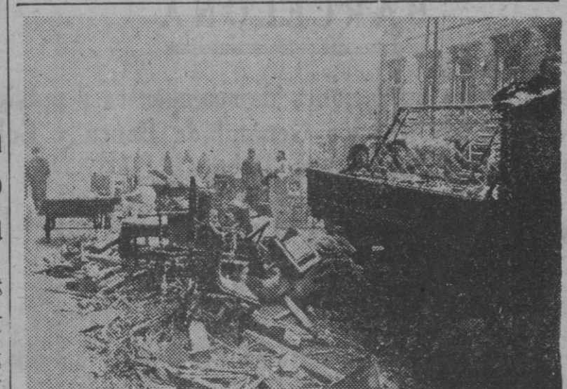
Helsinki, la capital de Finlandia, ha sido estos días objetivo preferente de las incursiones de la aviación soviética. He aquí los efectos de los bombardeos sobre las viviendas de la población civil.