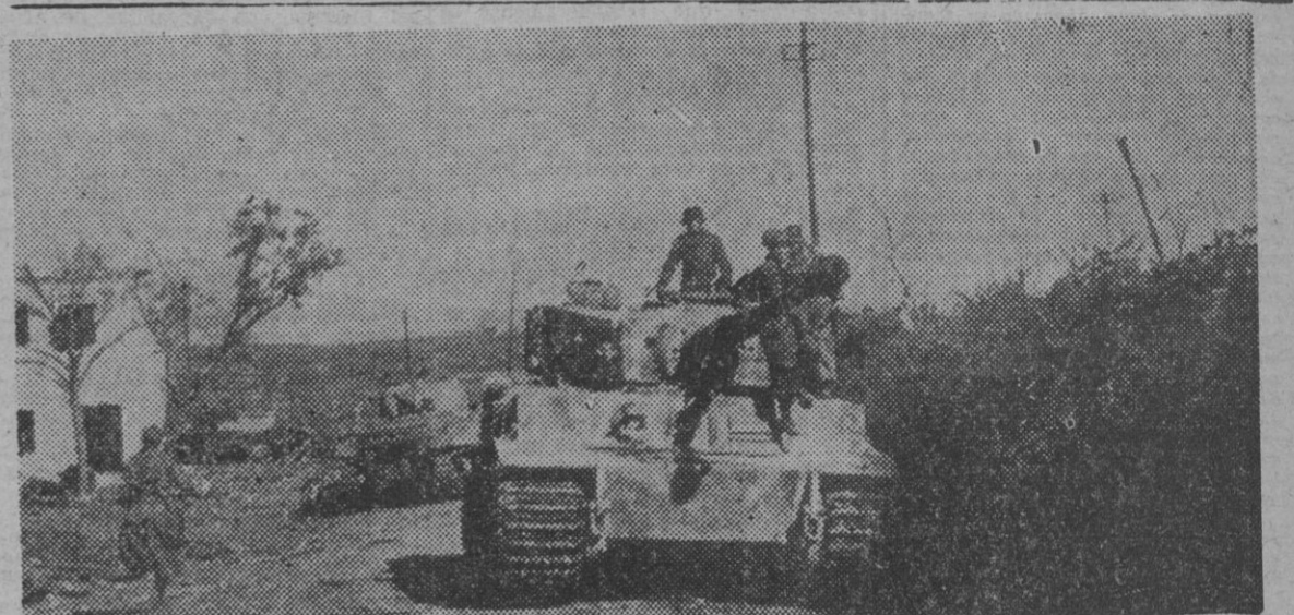
Tanques pesados alemanes avanzan hacia la línea de fuego para emplearse en la batalla de Aprilia.