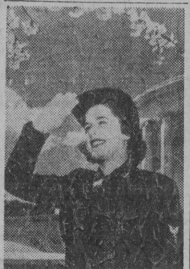
Muchacha especialista en fotografías, incorporada al Cuerpo Auxiliar Femenino de la Armada norteamericana.

Los diarios extranjeros en Inglaterra no deben hacer propaganda contra la unidad aliada