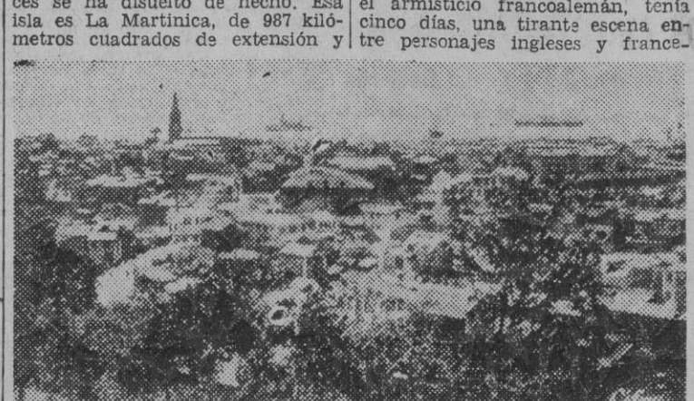
Vista general de Fort de France.