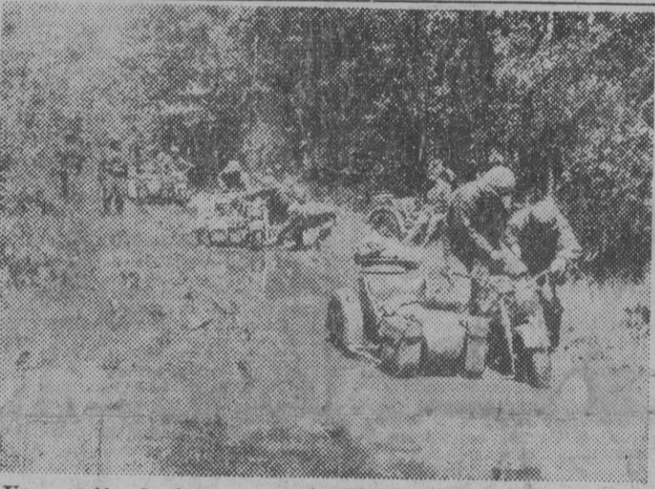
Una sección de fuerzas motorizadas alemanas vadeando un río para dirigirse al lugar del combate.

La evacuación de Catania, simple alteración en las líneas de defensa del Eje