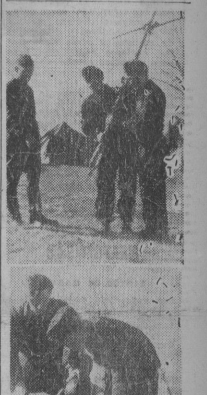
Mediante este curioso aparato, los soldados alemanes llegan a averiguar el lugar por donde pasa una corriente de agua. Después de hecho el pozo, se coloca la bomba que ha de abastecer ya cada día al personal de este aeródromo.

El ministro thailandés de Relaciones Exteriores, en Tokio