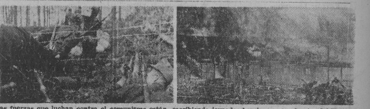
Las fuerzas que luchan contra el comunismo están escribiendo jornadas heroicas en los frentes del Este. Nuestras fotos presentan unos contraataques victoriosos donde las tropas del Eje obtuvieron un éxito claro en Biegorod. (Fotos Orbis).