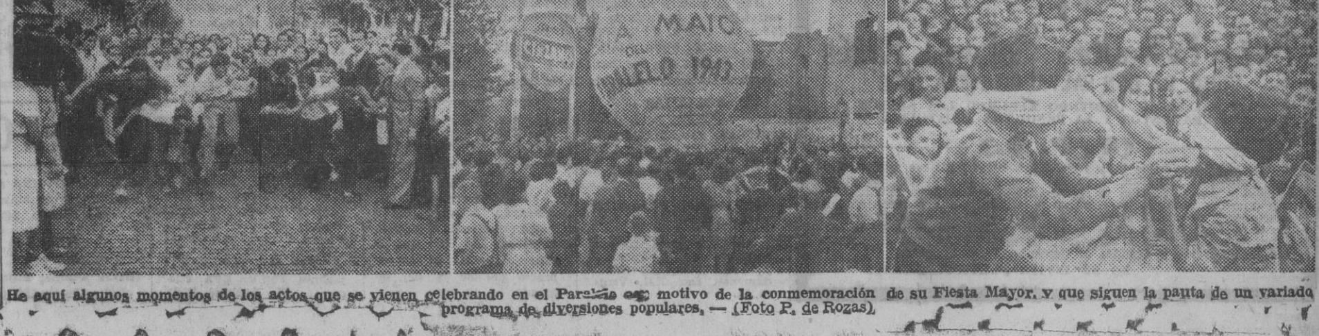
He aquí algunos momentos de los actos que se vienen celebrando en el Paralelo con motivo de la conmemoración de su Fiesta Mayor, y que siguen la pauta de un variado programa de diversiones populares.