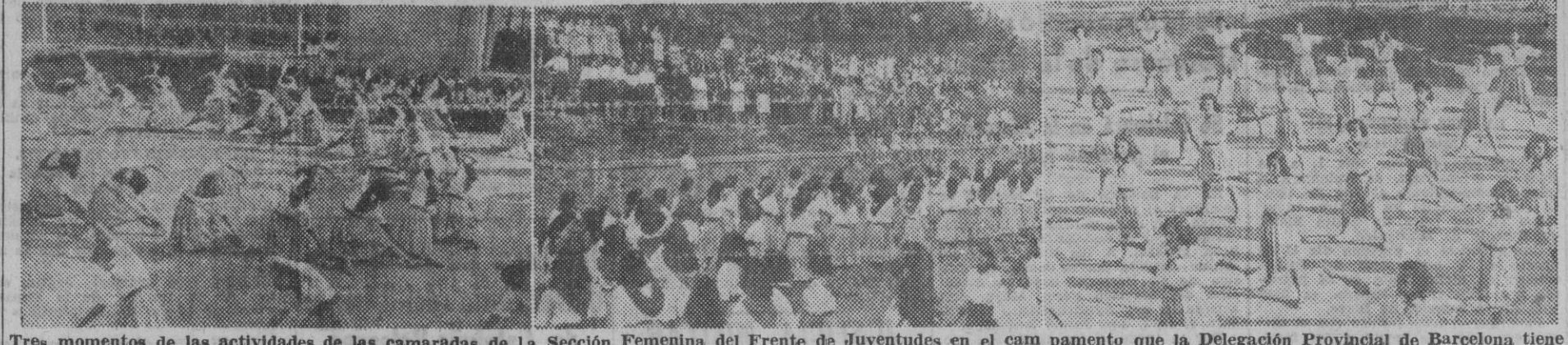
Tres momentos de las actividades de las camaradas de la Sección Femenina del Frente de Juventudes en el campamento que la Delegación Provincial de Barcelona tiene instalado en San Hilario, en las horas dedicadas a la educación física de las acampadas.