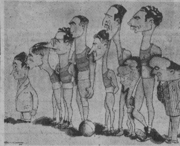
El conjunto azulgrana que el próximo lunes, en Palma de Mallorca, contendrá con el C. D. Layetano, en la final de la Copa de S. E. el Generalísimo