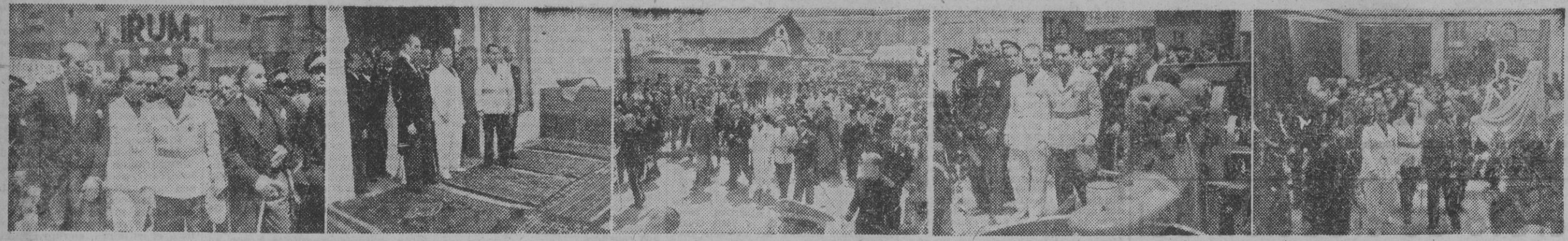
Diversos aspectos de la visita girada por nuestras autoridades y jerarquías, presididas por el Excmo. señor ministro de Industria y Comercio, camarada Carceller, a las diferentes instalaciones de la XI FERIA Oficial e Internacional de Muestras de Barcelona.