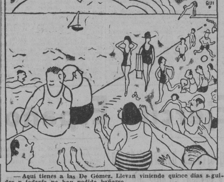
—Aquí tienes a las De Gómez. Llevan viniendo quince días seguidos y todavía no han podido bañarse.