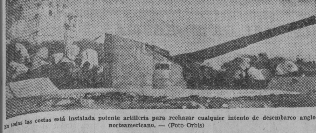
En todas las costas está instalada potente artillería para rechazar cualquier intento de desembarco anglo-norteamericano.