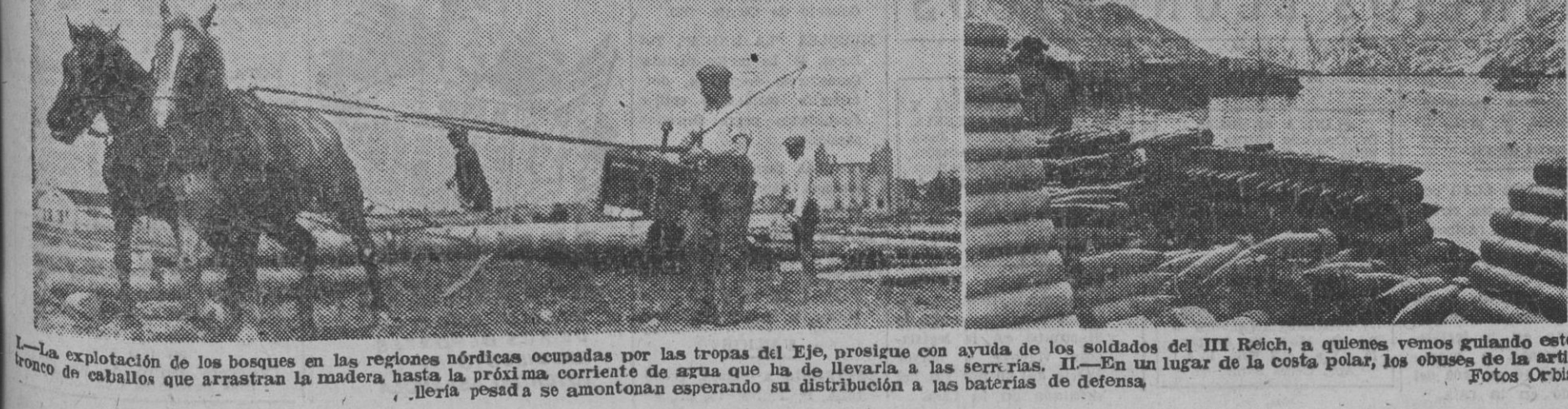
La explotación de los bosques en las regiones nórdicas ocupadas por las tropas del III Reich, a quienes vemos guiando este tronco de caballo que arrastran la madera hasta la próxima corriente de agua que ha de llevarla a las serrías. II.—En un lugar de la costa polar, los obuses de la artillería pesada se amontonan esperando su distribución a las baterías de defensa.