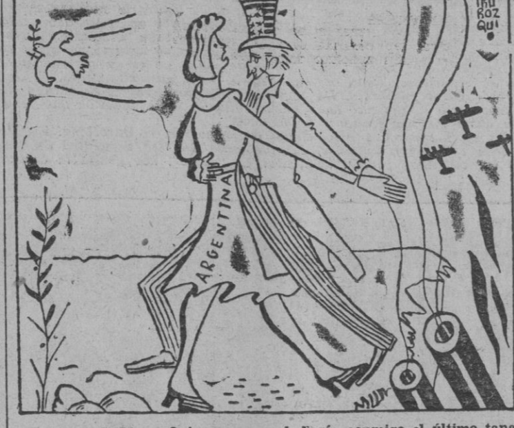
EL TIO SAM: — Quieras que no bañarás conmigo el último tango.