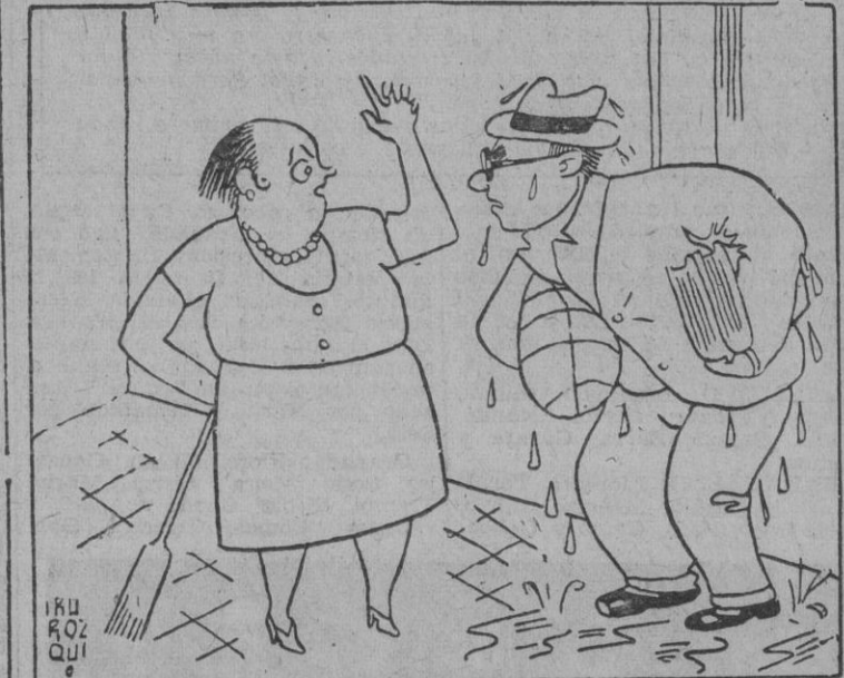
—Pero, de dónde vienes, hecho una sopa? —De la Feria del Libro.