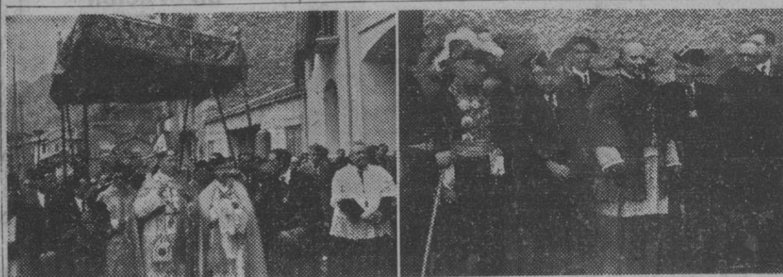
El ilustrísimo señor obispo de Seo de Urgel, doctor Iglesias, ha hecho su entrada oficial en el Principado de Andorra, del que es copríncipe. He aquí dos momentos del solemne acto, en los que se ve al doctor Iglesias con las autoridades del Principado y representantes de Francia.