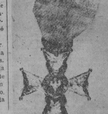
Fotografía de dos condecoraciones del teniente coronel polaco Hatacinski Andresen, obtenida al descubrirse sus restos entre los fusilados por la G. P. U. en Esmolensko

Los asesinatos rusos de la G. P. U. en Esmolensko