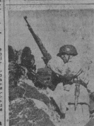
Soldado alemán de infantería cargando de nuevo fusil ametrallador de Reich ha sido dotado al Ejército del Reich

La aviación bolchevique ha perdido 1,002 aparatos en el curso del mes de abril, de ellos, 902 en combates aéreos; 21 por la acción de la D. C. A., y 10 por las fuerzas navales alemanas. Los demás fueron destruidos en el suelo.