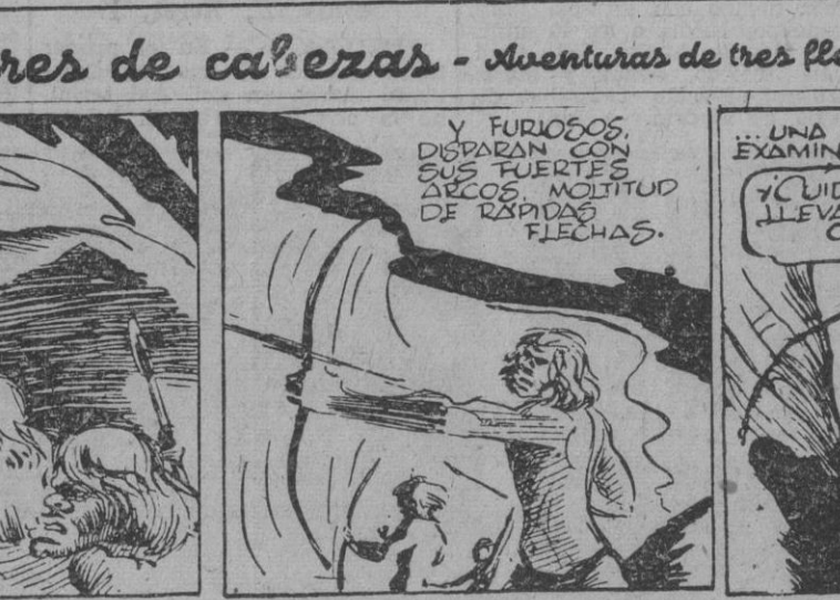
CON ESPAN TOEN LOS TELE AMIGOS QUE LOS CARLOS WIEREN CON EL VENENO LADRO DE LOS SELVA SUZA MEDICINAS RECHAZAN LA AGRESION CON LA ARDUO CASO REQUIERE

Los cazadores de cabezas - Aventuras de tres flechas españolas