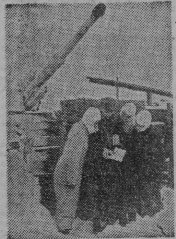
A veces cuesta a los soldados una larga caminata el procurarse un libro; pero el solaz del permiso de unas horas se ve prolongado por la grata lectura, que hará más llevaderas las horas transcurridas en las instalaciones industriales creadas en Asia por la U. R. S. S. con objeto de situar su industria pesada fuera del alcance de las fuerzas europeas. El combinado Magnitogorsk - Kusnets, reforzado con la aportación de las fábricas que han sido destruidas en la Rusia europea a consecuencia del avance alemán, y los nuevos industriales indostriales indostriales surgidos en otras regiones, bastan a producir el material que necesita Stalin para continuar la guerra con esperanza de victoria.

La división "Grossdeutschland" ha rechazado los ataques enemigos en Borisovka y avanzó seguidamente bastante hacia el este. Cuarenta y siete tanques soviéticos fueron destruidos en esta acción. Al S. de Orel, al S. de Wyasma y cerca de Staraya Rusa han terminado en graves derrotas los intentos del enemigo de romper nuestro frente. El adversario perdió 93 tanques en Wyasma, además de muchos hombres y material de diversas clases. La aviación alemana ha apoyado a las tropas de tierra. Una formación de bombarderos norteamericanos ha atacado ayer Alemania del NO. zona costera. La población, especialmente en Bremen, tuvo víctimas. Siete bombarderos adversarios fueron derribados sobre el mar por nuestros cazas y otros dos por las baterías de la D. C. A. de la zona del NO. del Reich. Después de un feliz ataque diurno contra un puerto meridional de Inglaterra, la aviación alemana ha bombardado la ciudad industrial de Norwich y Great Yarmouth, por la noche. Se han provocado grandes incendios. Tres de nuestros aviones no han regresado. Nuestros submarinos se encuentran empeñados en duras batallas contra convoyes enemigos, en el Atlántico. — Efe.