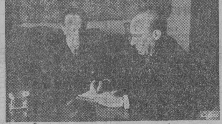
El nuevo embajador de España en el Quirinal y miembro de la Junta Política, don Raimundo Fernández Cuesta, es recibido por el ministro de Asuntos Exteriores durante su estancia en Madrid.