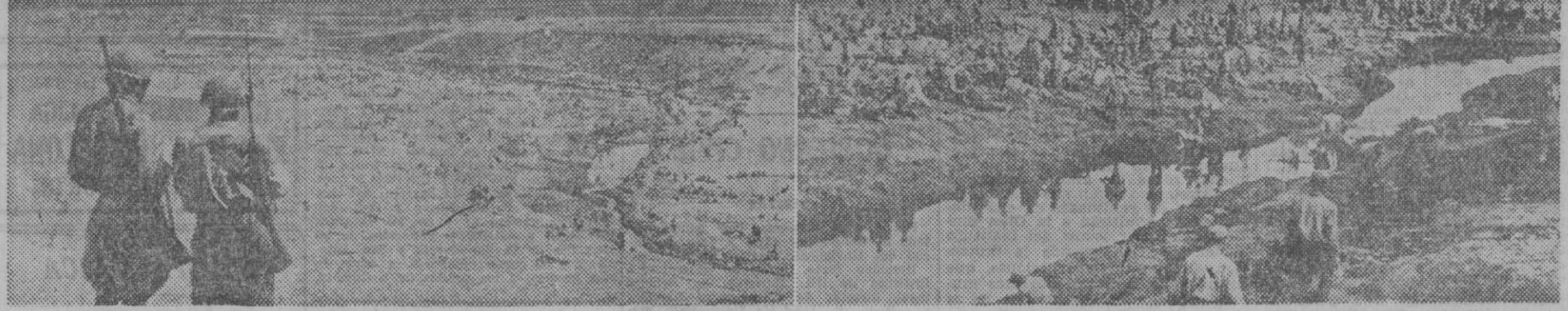
Como resultado de los ataques lanzados últimamente por las tropas bolcheviques, y la vigorosa respuesta de los soldados del Eje, los campos de concentración dispuestos por las fuerzas alemanas en el Este se llenan cada día con nuevos contingentes de soldados rusos caídos en su poder.