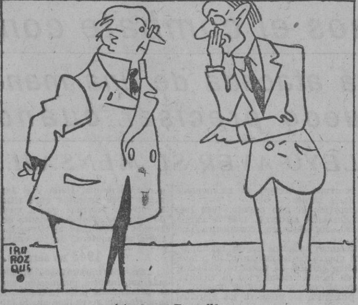
Graud se entrevistará con Degaulle. — Pues que tenga cuidado no lo "degaulle".