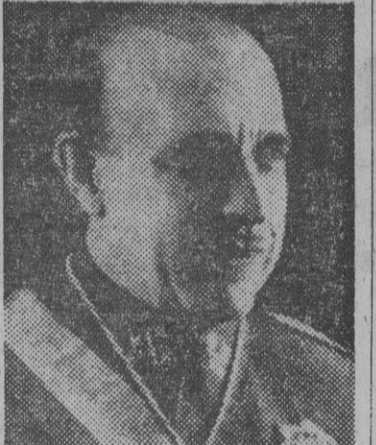
El jefe del Gobierno portugués, Oliveira Salazar, y el ministro de Asuntos Exteriores de España, figuras prominentes de la actualidad internacional