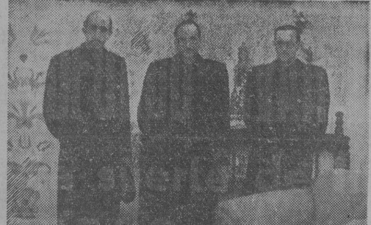
El Ministro Secretario del Partido, camarada Arrese, en la Delegación Nacional de Sindicatos, durante el acto de inauguración de la Exposición de Artesanía, que tuvo lugar en el día de ayer

Exposición de muebles GALERIAS MALDA Entrada libre al primer piso Una gran riqueza en muebles de todos los estilos