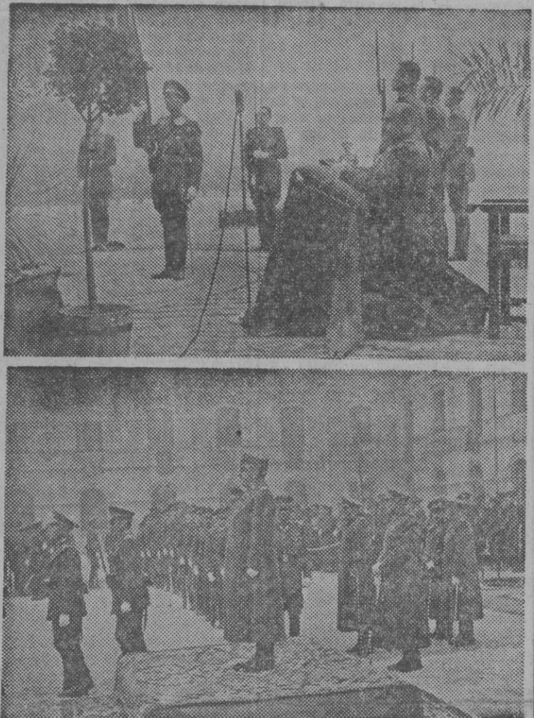
S. E. el Jefe del Estado en los actos celebrados con motivo de entrar a la Academia General Militar su vieja y gloriosa Bandera