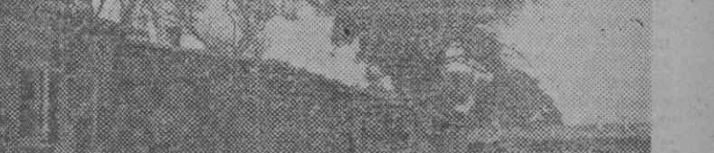
Nuestros gloriosos soldados de la "División Azul" conquistan un pueblo ruso en el sector del Lago Imen, y recién liberado, por vez primera después de muchos años, se celebra la santa misa, siguiéndola la población civil, con gran recogimiento.

Nuestros gloriosos soldados de la "División Azul" conquistan un pueblo ruso en el sector del Lago Imen, y recién liberado, por vez primera después de muchos años, se celebra la santa misa, siguiéndola la población civil, con gran recogimiento.