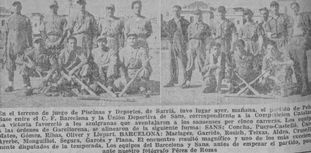
En el terreno de juego de Piscinas y Deportes, de Sarriá, tuvo lugar ayer, mañana, el partido de Pelota Base entre el C. F. Barcelona y la Unión Deportiva de Sans...