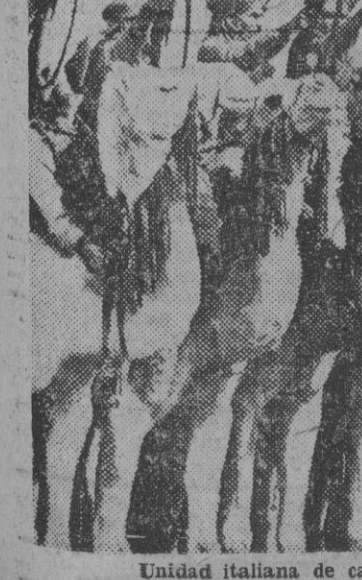
Unidad italiana de camellos que opera en el frente de Marmárica