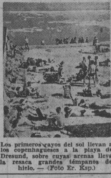
Los primeros rayos del sol llevan a los campesinos a la playa de Dresdun, sobre cuyas arenas lleva la resaca grandes témpanos de hielo.