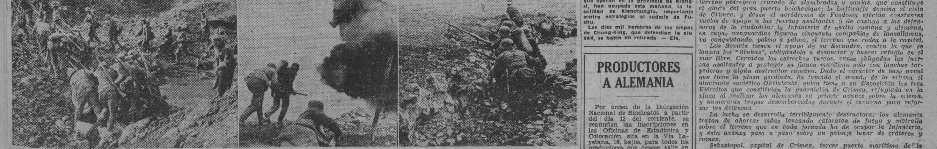
Varios momentos del furioso ataque desarrollado actualmente contra la fortaleza de Sebastopol: 1. Emplazamiento de un cañón en el cinturón que rodea a la ciudad. 2. Sección de lanzallamas atacando las posiciones rojas cavadas en la tierra. — 3. Patrulla de zapadores lanzallamas haciendo fuego sobre el terreno pedregoso, en el que no es posible cubrirse. — (Fotos Orbis)