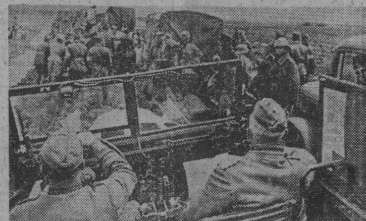
Von Mannstein, general en jefe del Ejército germano-rumano que ataca a las fuerzas soviéticas de Sebastopol, marchando a las líneas avanzadas para dirigir las operaciones