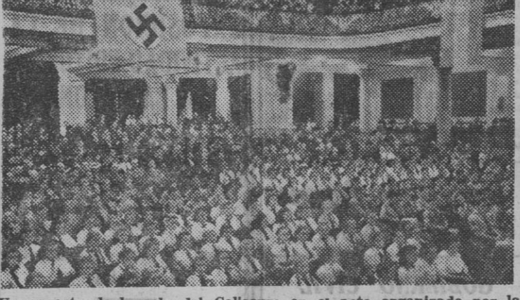
Un aspecto de la sala del Coliseum en el acto organizado por la colonia alemana, con motivo del cumpleaños del Führer. (Información pág. 3ª).