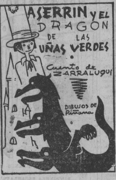
ASERRIN Y EL DRAGON DE LAS UNAS VERDES. Cuenta de ZARRALUQUI. DIBUJOS DE PIZARRA.