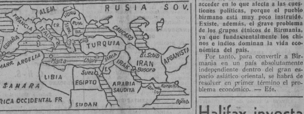
En el vasto espacio integrado por los Balcanes y el Próximo Oriente. Diversos viajes efectuados previamente por los tres diplomáticos, les ha permitido obtener copiosas y detalladas informaciones relativas a todos los países que integran dichos territorios. Lo que ha de permitirles en un futuro, en un memorándum detallado, en orden a la realización de los planes estratégicos de inmediata ejecución, elaborados conjuntamente por los tres naciones aliadas por el Pacto Tripartito.

Estos parlamentarios norteamericanos realizan ejercicios de puntería con fusiles ametrallados.