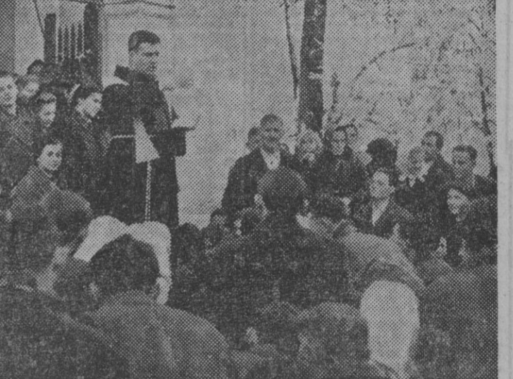
En los últimos meses el número de bautizos en Croacia han aumentado. He aquí numerosos individuos que pertenecían a la Iglesia griego-oriental que reciben el bautismo, convirtiéndose al catolicismo