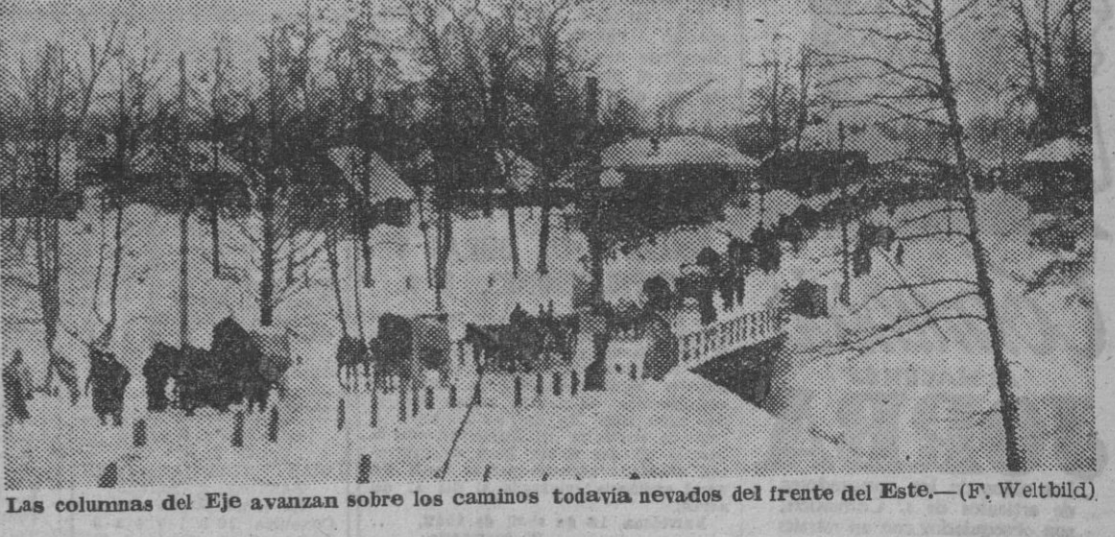
Las columnas del Eje avanzan sobre los caminos todavía nevados del frente del Este.