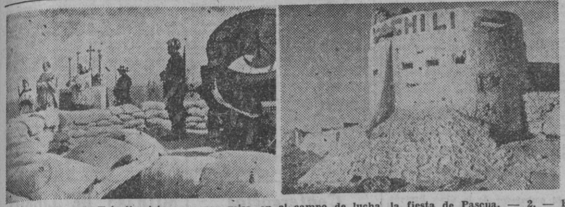
1. — El obispo de Trípoli celebra con una misa, en el campo de batalla, la fiesta de Pascua. — 2. — El fuerte del Mekili, posición del máximo valor estratégico, construido en la cima del monte más alto de Cirenaica, y que se halla en poder de las fuerzas del Eje.