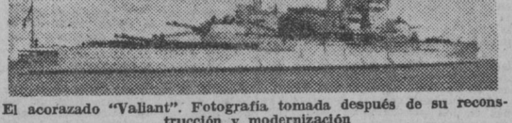
El acorazado «Vallant». Fotografía tomada después de su reconstrucción y modernización

El acorazado «Queen Elizabeth», que según la información precedente se halla en el dique de Alejandría reparando averías, tiene las mismas características del «Vallant», a cuya serie pertenece.