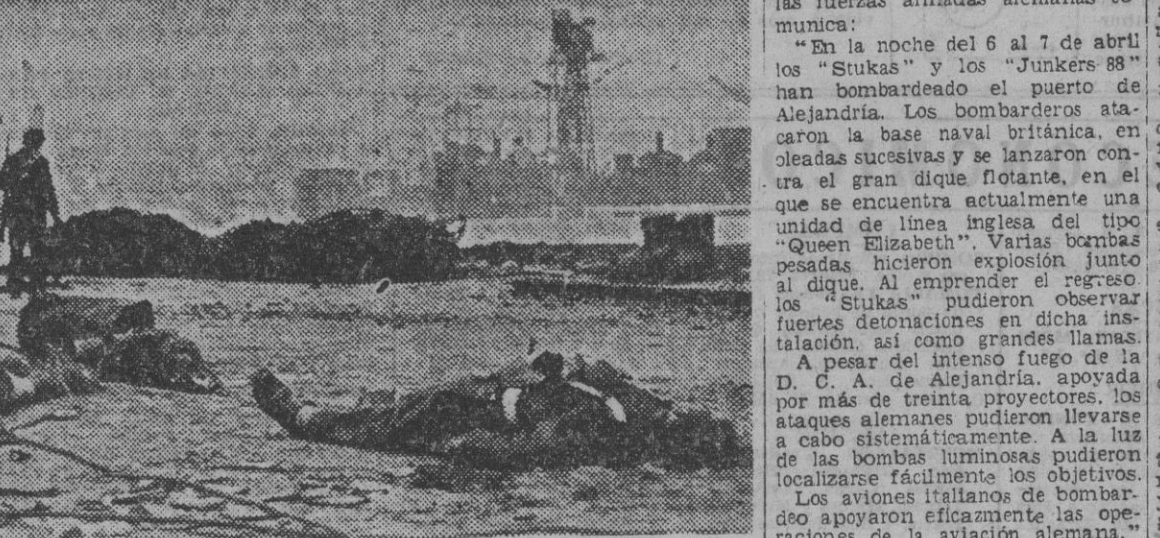
El malogrado desembarco inglés en la bahía de Saint Nazaire.