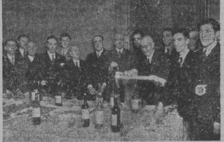
El laureado general Moscardó, Presidente del Consejo Nacional de Deportes, llegó ayer a Barcelona. Aquí le vemos en el acto celebrado con motivo de la entrega de los premios a los campeones aficionados de pelota vasca.