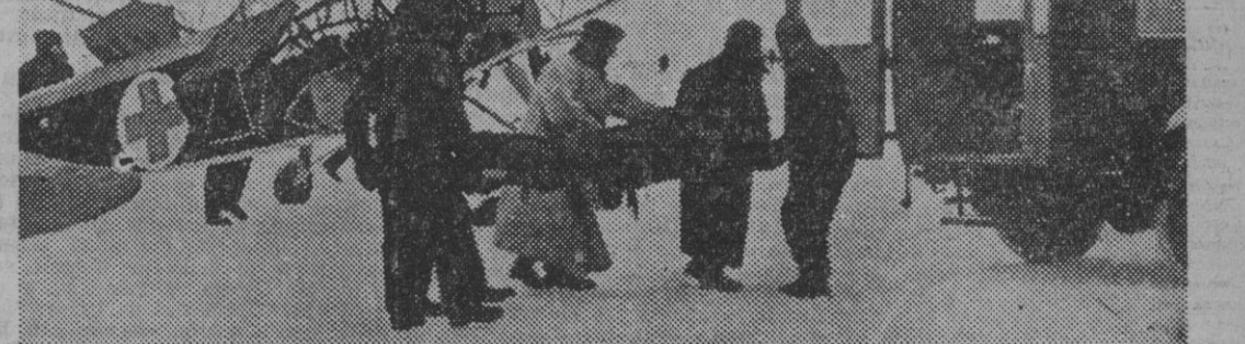
El avión "Storch" en el servicio de la Sanidad, para transportar los heridos graves a los hospitales.