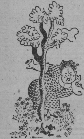
—¡Ah, el esquivo travieso! ¡Yo voy y me escondo detrás de un árbol, y él va y me encuentra en seguida...