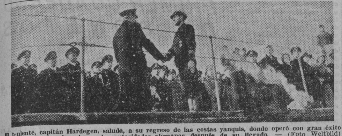
El teniente, capitán Hardegen, saluda, a su regreso de las costas yanquis, donde operó con gran éxito al mando de su submarino, a las autoridades alemanas después de su llegada.