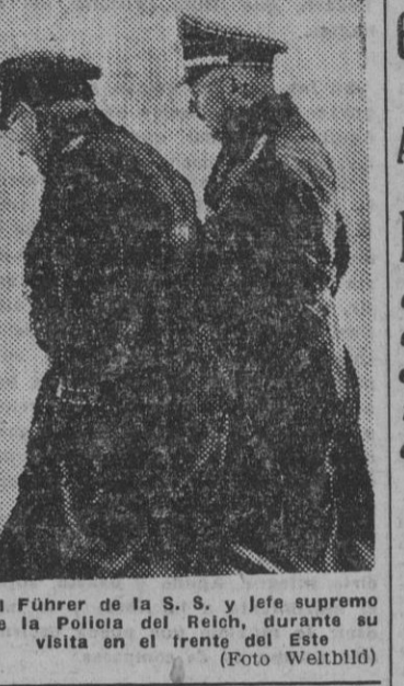
El Führer de la S. S. y jefe supremo de la Policía del Reich, durante su visita al frente del Este.