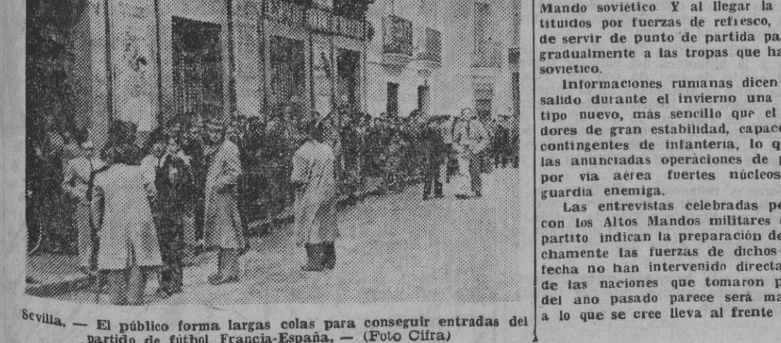
Sevilla. — El público forma largas colas para conseguir entradas del partido de fútbol Francia-España.