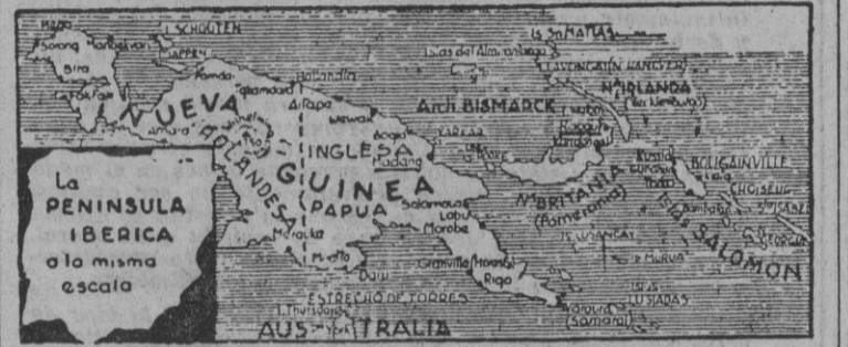
En las islas Salomón, por cuyas cercanías ha sido vista una flota japonesa, se hallan las últimas posiciones británicas avanzadas en el flanco derecho de Australia. Duenos los nipones del Archipiélago de Bismarck y costa este de Nueva Guinea, nada tendría de particular que trataran de completar la ocupación de las islas Salomón, para cerrar el cerco del Continente australiano por el nordeste.

La isla de Weh, en poder de las fuerzas japonesas TOKIO, 14. — Los japoneses, comunica la Agencia Domei, han ocupado la pequeña isla de Weh, al norte de Sumatra. — Efe.