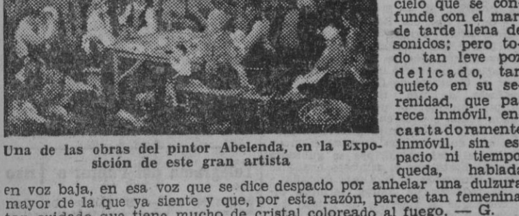
Una de las obras del pintor Abelenda, en la Exposición de este gran artista