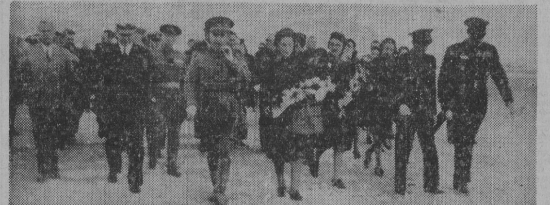
La Delegada Nacional de la Sección Femenina, Pilar Primo de Rivera, es recibida por las autoridades y jerarquías, a su llegada a Las Palmas.