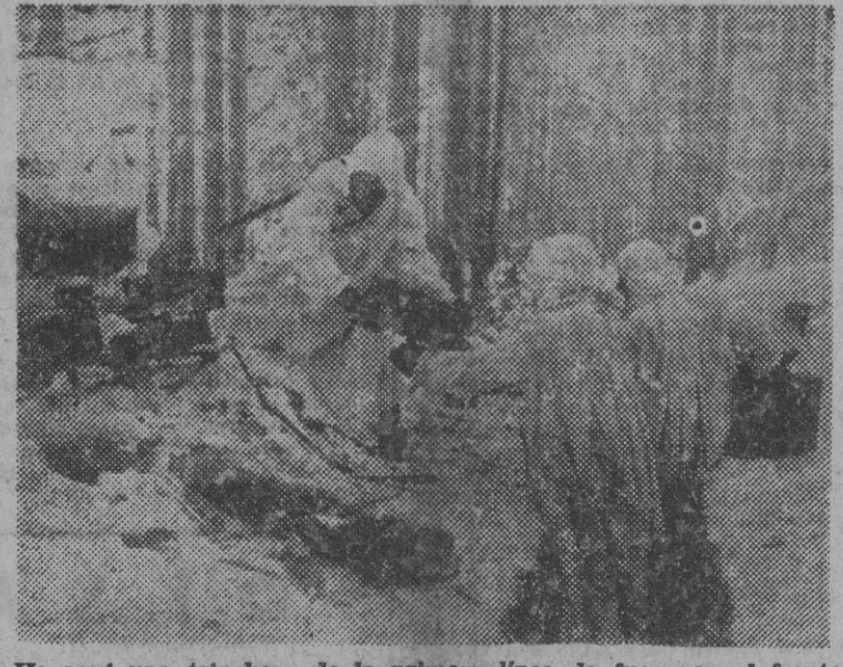
He aquí una trinchera de la primera línea de fuego en el frente ruso, en el momento de llegada de un convoy de municiones.

200,000 chinos casi cercados por los japoneses