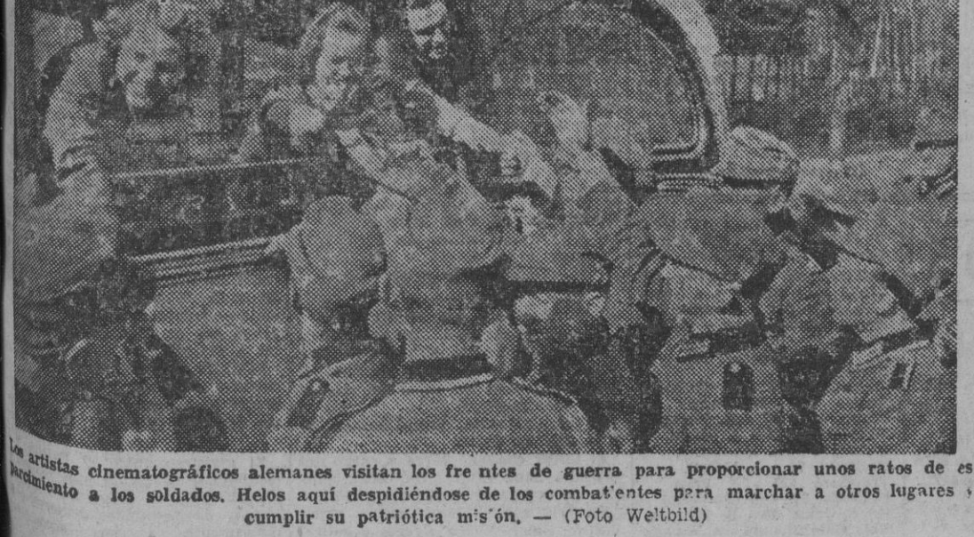
Los artistas cinematográficos alemanes visitan los frentes de guerra para proporcionar unos ratos de entretenimiento a los soldados. Helos aquí desfilando por los combatientes para marchar a otros lugares a cumplir su patriótica misión.