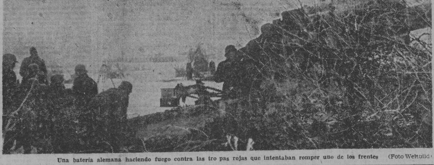
Una batería alemana haciendo fuego contra las tropas rojas que intentaban romper uno de los frentes