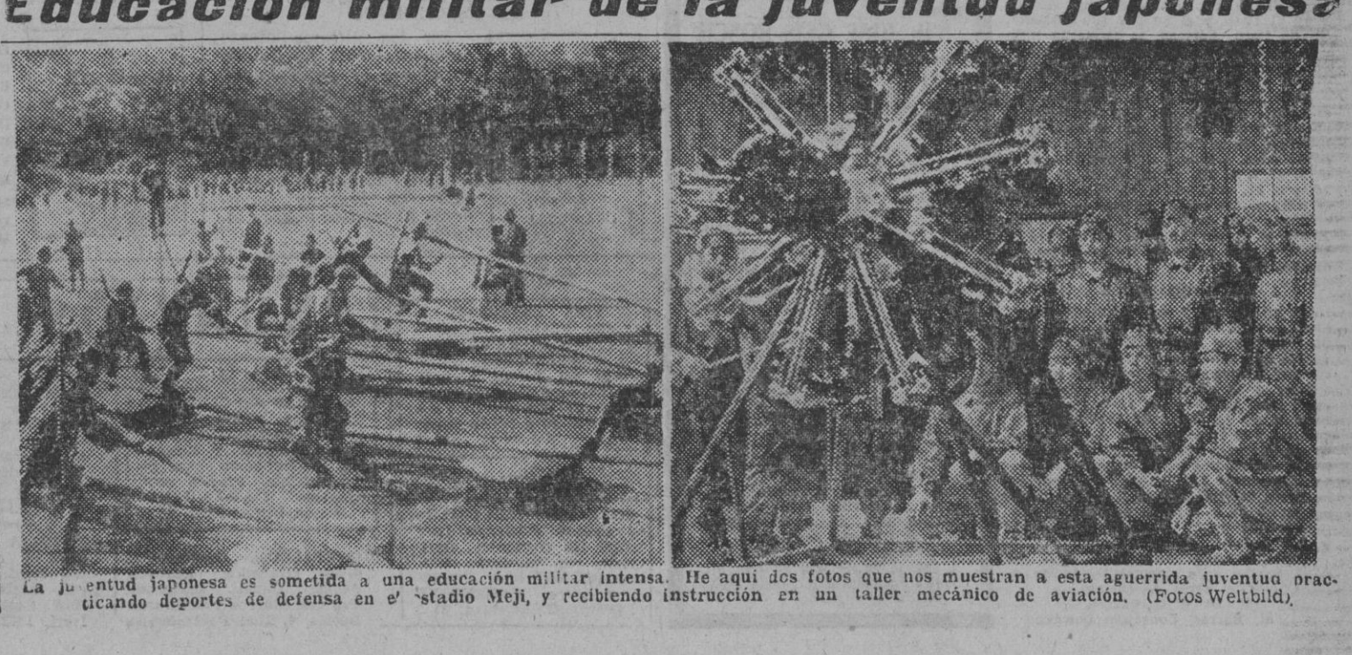
La juventud japonesa es sometida a una educación militar intensa. He aquí dos fotos que nos muestran a esta aguerriada juventud practicando deportes de defensa en el «stadío Meji», y recibiendo instrucción en un taller mecánico de aviación.