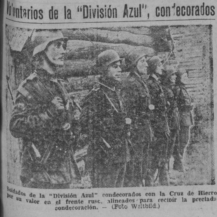
Soldados de la «División Azul» condecorados con la Cruz de Hierro por su valor en el frente ruso, alineados para recibir la preciada condecoración.

TOKIO, 4. — En los centros militares de la capital nipona se destaca la que la ocupación de Mulein significa principalmente el bloqueo de Rangún y de la carretera de Birmania, único punto de contacto entre el Ejército de Chiang-Kai Shek y sus aliados. Las fuerzas japonesas, se anuncia el martes por la mañana, han cruzado por distintos puntos el río Salween, al norte de la ciudad y han atacado las posiciones británicas en la orilla con artillería. Las noticias que se han recibido hasta ahora no pueen dar cuenta si estas posiciones están cercadas o si los ingleses se han retirado aún más. Las informaciones de procedencia inglesa subrayan la extraordinaria importancia estratégica del río Salween. Indican también los ingleses que las acciones niponas son muy reducidas. Por lo visto, trata de Mando británico de mantener estas posiciones que constituyen la única defensa posible de Rangún. Añuncian que han concentrado en la línea del río fuertes contingentes de tropas indias. Los habitantes de Mulein que abandonaron la ciudad al aproximarse los japoneses, han comenzado a regresar. Toda la población acoge con cordialidad a los soldados nipones. — Efe.