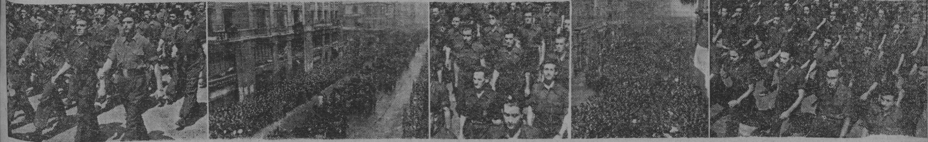
Más de tres horas ha durado esta mañana el impresionante desfile de los productores barceloneses ante S. E. el jefe del Estado. He aquí diversos aspectos que muestran la grandiosidad del acto