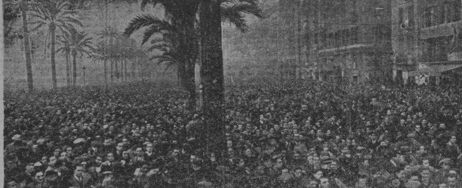
IMPRESIONANTE y de emotividad extraordinaria jamás registrada en actos celebrados en nuestra ciudad, ha sido la concentración de productores que ha tenido lugar esta mañana y que han desfilado ante S. E. el Generalísimo Franco. Todos los centros de producción de nuestra ciudad han interrumpido en el día de hoy sus actividades cotidianas, para testimoniar ante la figura del Caudillo su adhesión y fe inquebrantables y así 400.000 productores han pasado formados en milicia de trabajo ante S. E. el jefe del Estado.

La manifestación de esta emocionada inquietud, que señala principio de etapa en los anales de la Revolución, tiene también su síntesis evidente. El caudillaje de Franco ha puesto al pueblo en posesión de sus energías heredadas. Y no hay, no puede haber, más jefe indiscutible que Franco, que ha forjado en los espíritus y en la Geografía el vigor unitario de España.