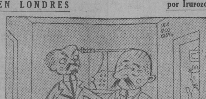
¿Que me dice usted de la Dieta? — Pues que nos van a dejar en ayunas.