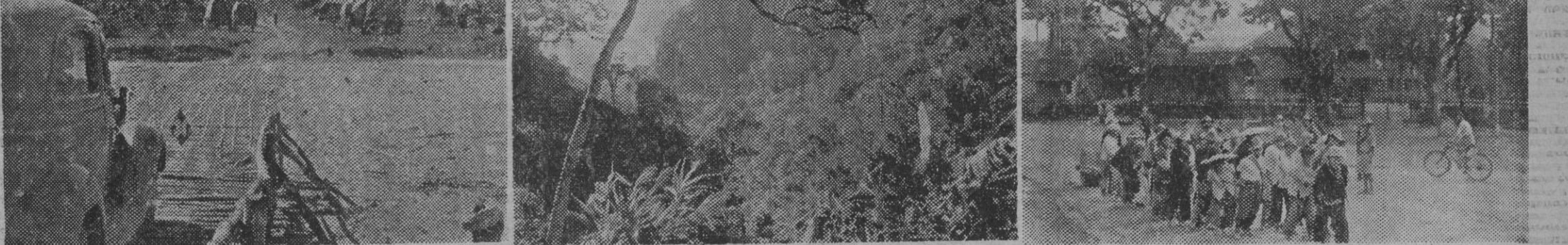
Los ingleses han acumulado fuertes contingentes de tropas en la frontera birmano-thailandesa, pero éstos han sido barridos por las fuerzas japonesas, que marchan arrolladoramente hacia la capital del país. La primera foto (véase tomada en uno de los puntos por donde han penetrado los japoneses en Birmania. Las carreteras primitivas precisan a trechos de esas esterillas de paja de arroz, para que puedan circular vehículos. La segunda nos da una impresión exacta de la selva, a través de la cual han avanzado los japoneses. La tercera nos muestra el atraso en que se encuentra el país, donde hombres, mujeres y chicos sustituyen a las bestias de carga.

Deseo que este Aniversario sea un paso más para la reconstrucción de la gran familia española y tengo la confianza plena de que Dios reserva a nuestro pueblo, que ha sufrido tanto, días de prosperidad y grandeza, si sabemos conservar nuestra unidad interior en torno al Caudillo.