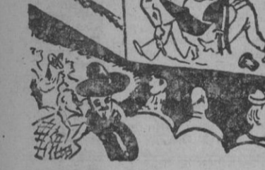
—Perdone el señor, pero... ¿no se quitará el sombrero ni ahora que pasa un muerto?—