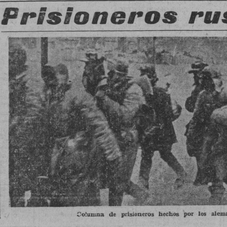
Columna de prisioneros hechos por los alemanes en Feodosia, dirigiéndose a la retaguardia