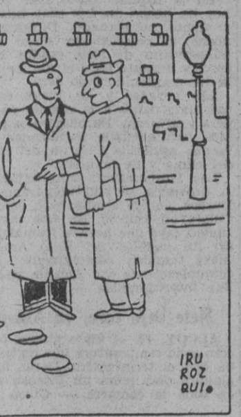
«Este hombre es un ladrón; me ha robado ochenta mil duros. ¿Cómo? Pero, es posible?.. Si; me ha negado la mano de su hija.»