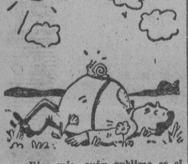
«Dios mío, cuán sublime es el mundo visto desde esta altura!» (De «Die Woche»)