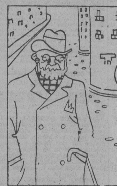
«Este hombre es un ladrón; me ha robado ochenta mil duros. ¿Cómo? Pero, es posible?.. Si; me ha negado la mano de su hija.»