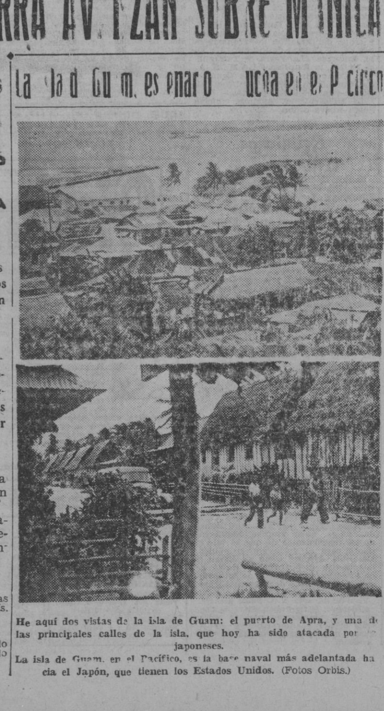
He aquí dos vistas de la isla de Guam: el puerto de Apra, y una de las principales calles de la isla, que hoy ha sido atacada por los japoneses.

En esta guerra, las primeras batallas aéreas tuvieron que darse con los mismos desahucados aviones que los pilotos de nuestro Ejército del Aire. Desde los primeros días de nuestra guerra aérea, en la Península — que por la deficiente calidad de material hubieron podido costear — y en las ciudades, se realizaron las primeras batallas aéreas de guerra. Nuestros aviones, de tipo antiguo, pero de gran valentía, se batieron con los aviones de la aviación japonesa, que en su mayoría eran de tipo moderno. Los pilotos de nuestra aviación, con un desprecio de las imposibilidades, se batieron con los aviones de la aviación japonesa, que en su mayoría eran de tipo moderno.