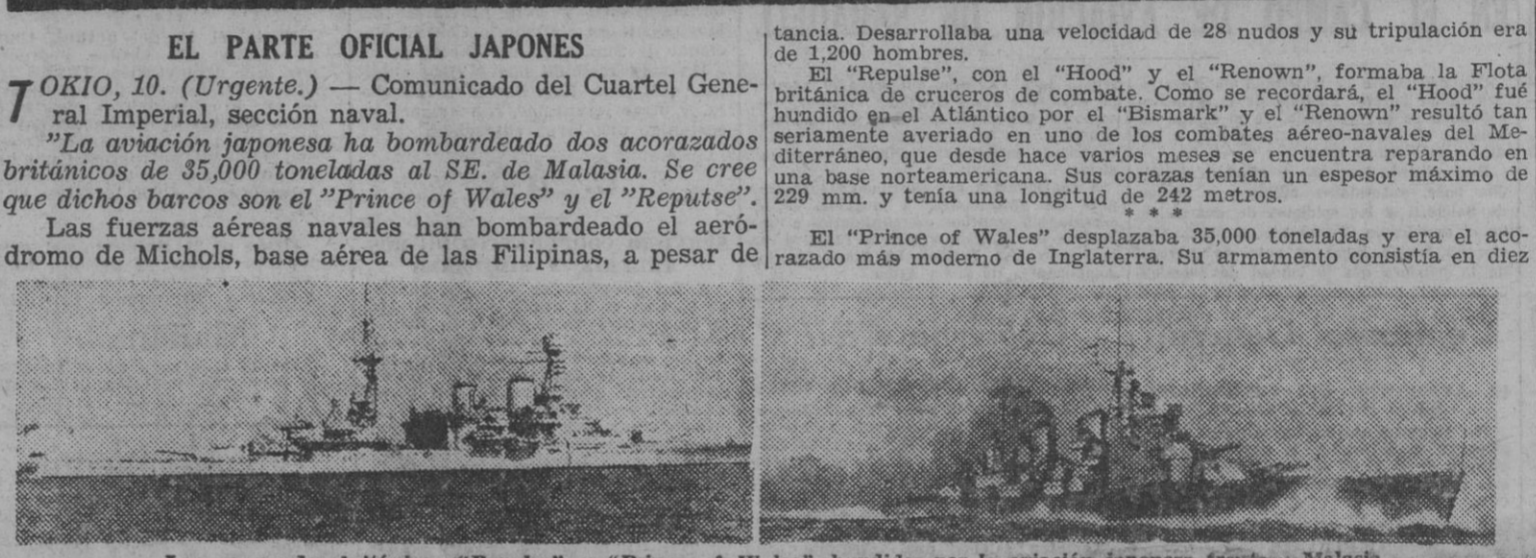
Los acorazados británicos "Repulse" y "Prince of Wales", hundidos por la aviación japonesa frente a Malasia.

TOKIO, 10. (Urgente). — Oficialmente se anuncia que los acorazados "Prince of Wales" y "Repulse" han sido hundidos por la Aviación japonesa, durante un combate aeronaval registrado al SE. de Malasia. — Efe.