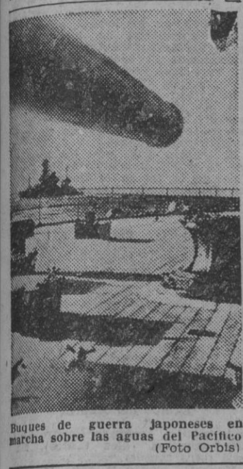
MOVILIZACION GENERAL EN AUSTRALIA

MELBOURNE, 9.—El Gabinete de Guerra ha ordenado la movilización de nuevos contingentes de tropas australianas.