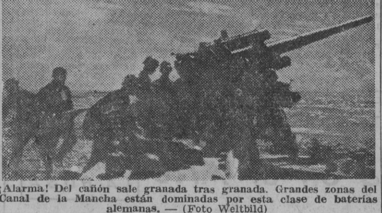
Alarma! Del cañón sale granada tras granada. Grandes zonas del Canal de la Mancha están dominadas por esta clase de baterías alemanas.

Encarnizada batalla en Libia Cañones contra Inglaterra