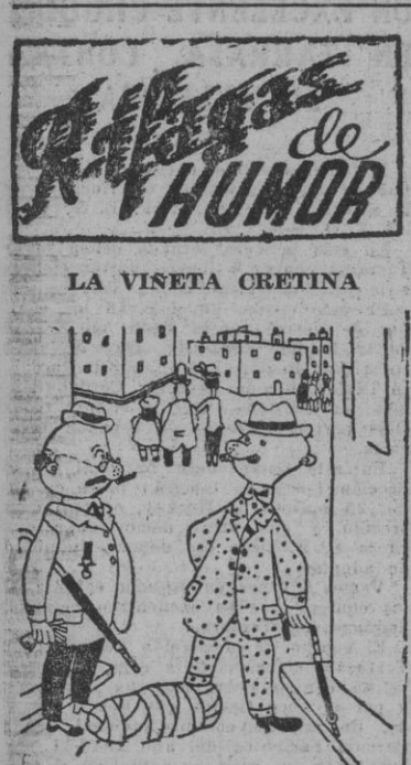
LA VISETA CRETINA