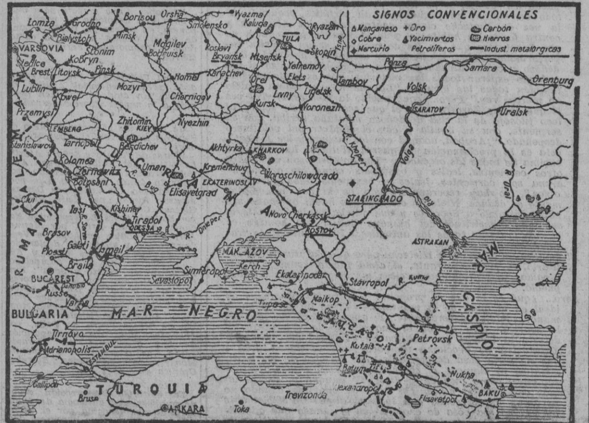
La brillante acción de Rostov por las fuerzas alemanas, de que se cuenta los comunicados de hoy, abre a las fuerzas aliadas contra el comunismo las puertas del Cáucaso...