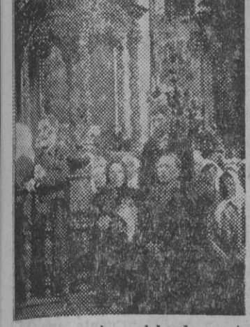
La primera misa celebrada en el... después de veinte años en que no ha habido culto religioso

Después de veinte años La policía ocupa los distritos mineros en huelga