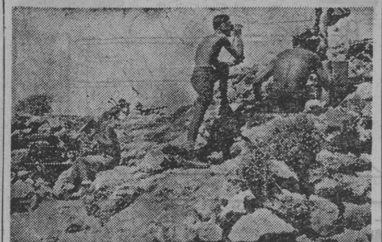
Una posición de las fuerzas germano-italianas en Tobruk donde en estos días se librará la batalla decisiva...