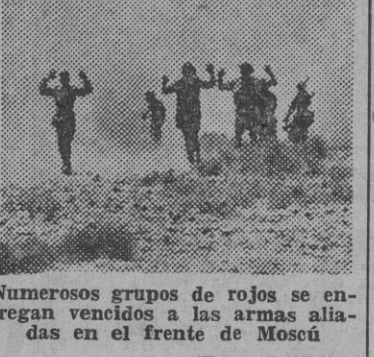
Numerosos grupos de rojos se entregan vencidos a las armas aliadas en el frente de Moscú

El hijo menor de Roosevelt protegido por la policía