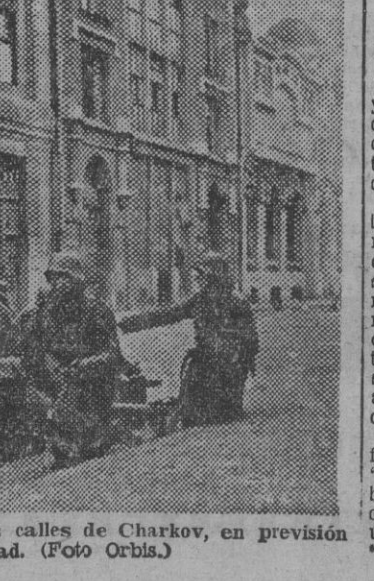
Artillería alemana antitanque en las calles de Charkov, en previsión de cualquier hostilidad.

Se compone de un acorazado, tres cruceros, 27 destructores, 50 submarinos y cincuenta unidades auxiliares