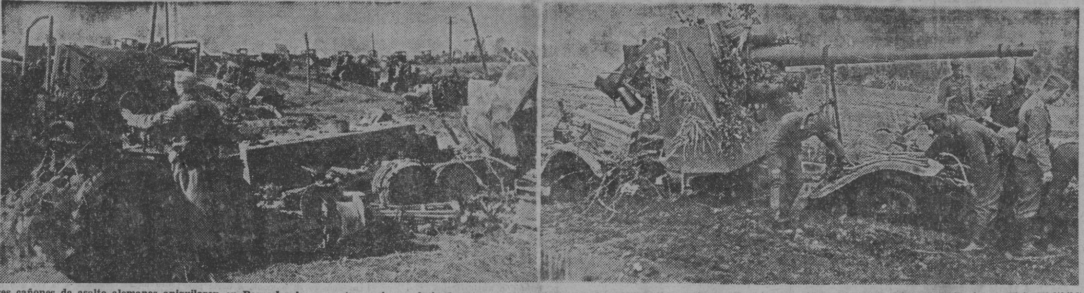
Tres cañones de asalto alemanes aniquilaban en Baryschewka a un tren rojo que huía de Kiev. — Una pieza antiaérea luchando contra los obstáculos que ofrece el suelo pantanosos de Rusia.