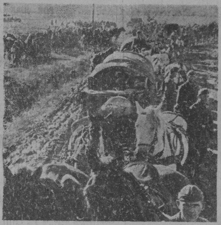
Columnas alemanas de aprovisionamiento, en marcha hacia las líneas avanzadas.