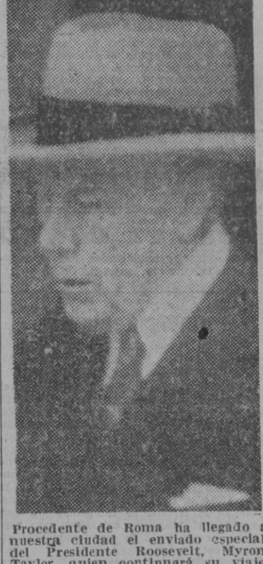
Precedente de Roma ha llegado a nuestra ciudad el enviado especial del Presidente Roosevelt, Myron Taylor, quien continuará su viaje a Portugal para embarcar hacia los Estados Unidos