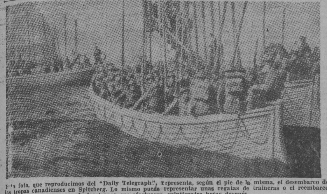
La foto, que reproducimos del "Daily Telegraph", representa, según el pie de la misma, el desembarco de las tropas canadienses en Spitzberg. Lo mismo puede representar unas regatas de traineras o el reembarco de las tropas que efectuaron veinticuatro horas después