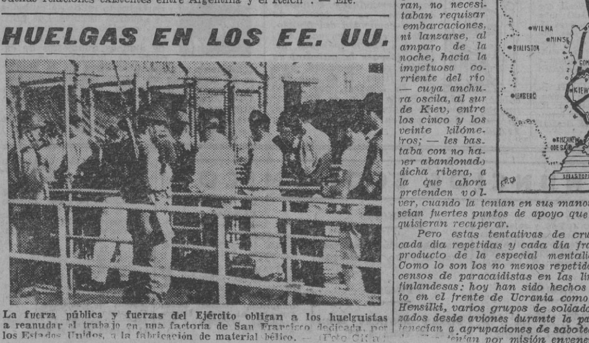
La fuerza pública y fuerzas del Ejército obligan a los huelguistas a reanudar el trabajo en una fábrica de San Francisco de Asís, por los Estados Unidos, y la fabricación de material bélico.

Vichy, 5. — Han sido liberados por las tropas japonesas dos misioneros católicos que fueron secuestrados por los comunistas chinos. — Efe.